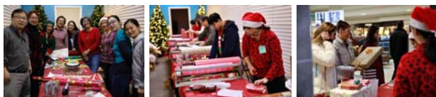
购物中心节日礼品包装