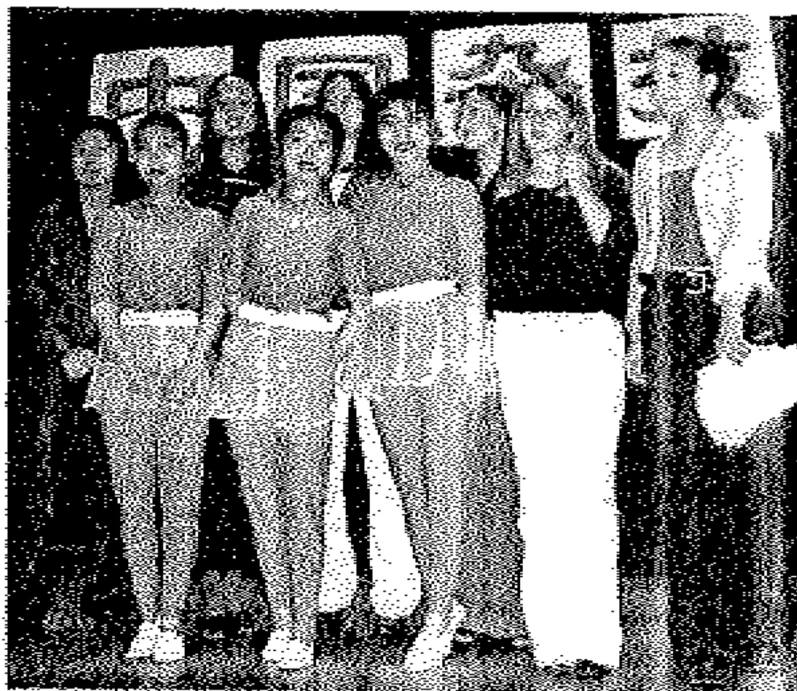
密西根新世纪中文学校演出时,吸引了大批美国朋友.这里的六名中学生参加义务服务