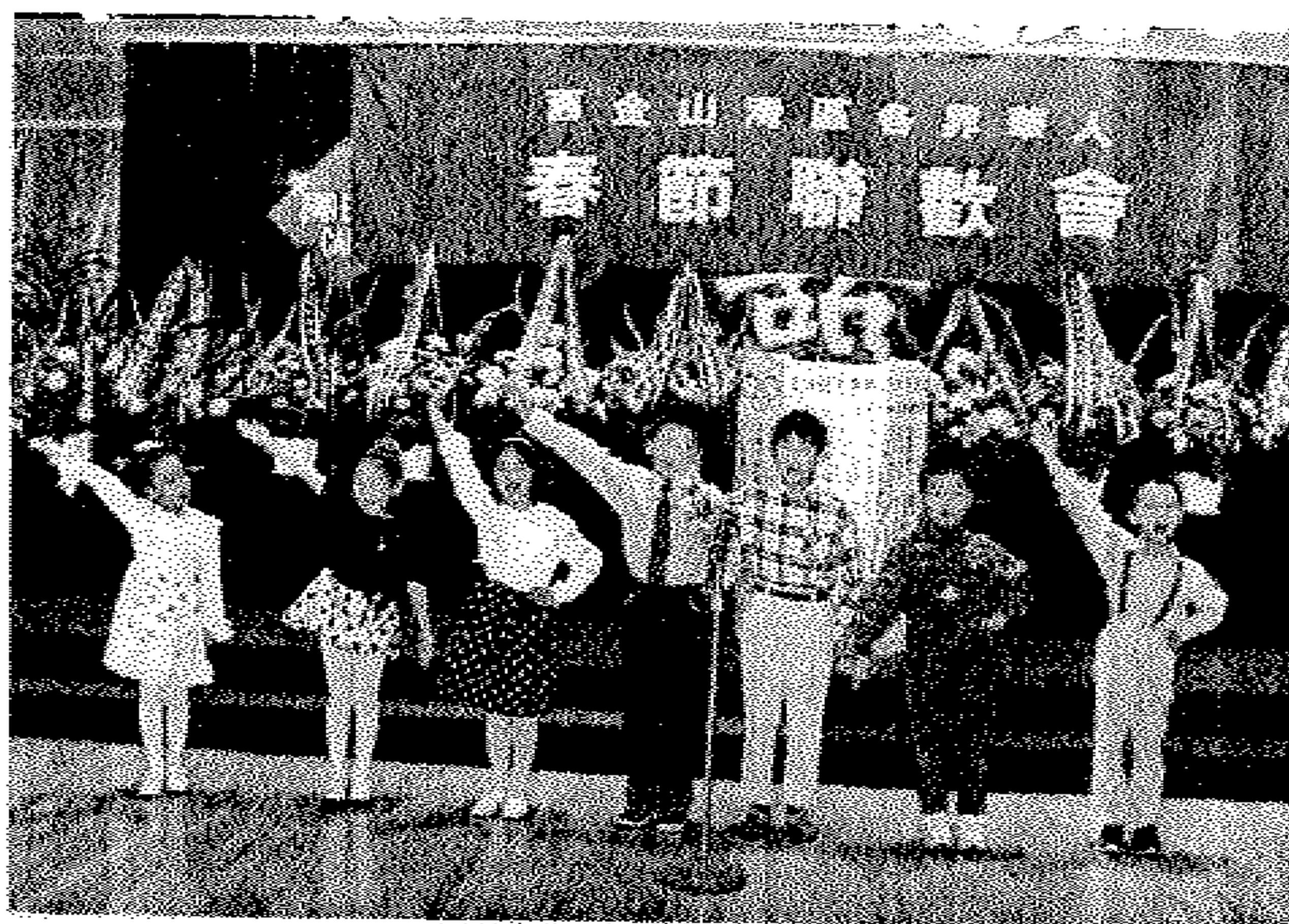
旧金山地区新登中文学校学生在湾区侨界春节联欢会上表演。

我协会学生群体中第一高峰, 即大多学校创建初期入学的学生, 目前已经到达高中。从去年开始, “毕业离校” 升入大学的人数将逐年增多。相应地, 家长们也逐渐开始关注大学入学问题。为此, 本期特地刊登了一组有关文章, 以期有所帮助。也欢迎广大读者推荐文章, 或者与我们分享心得。