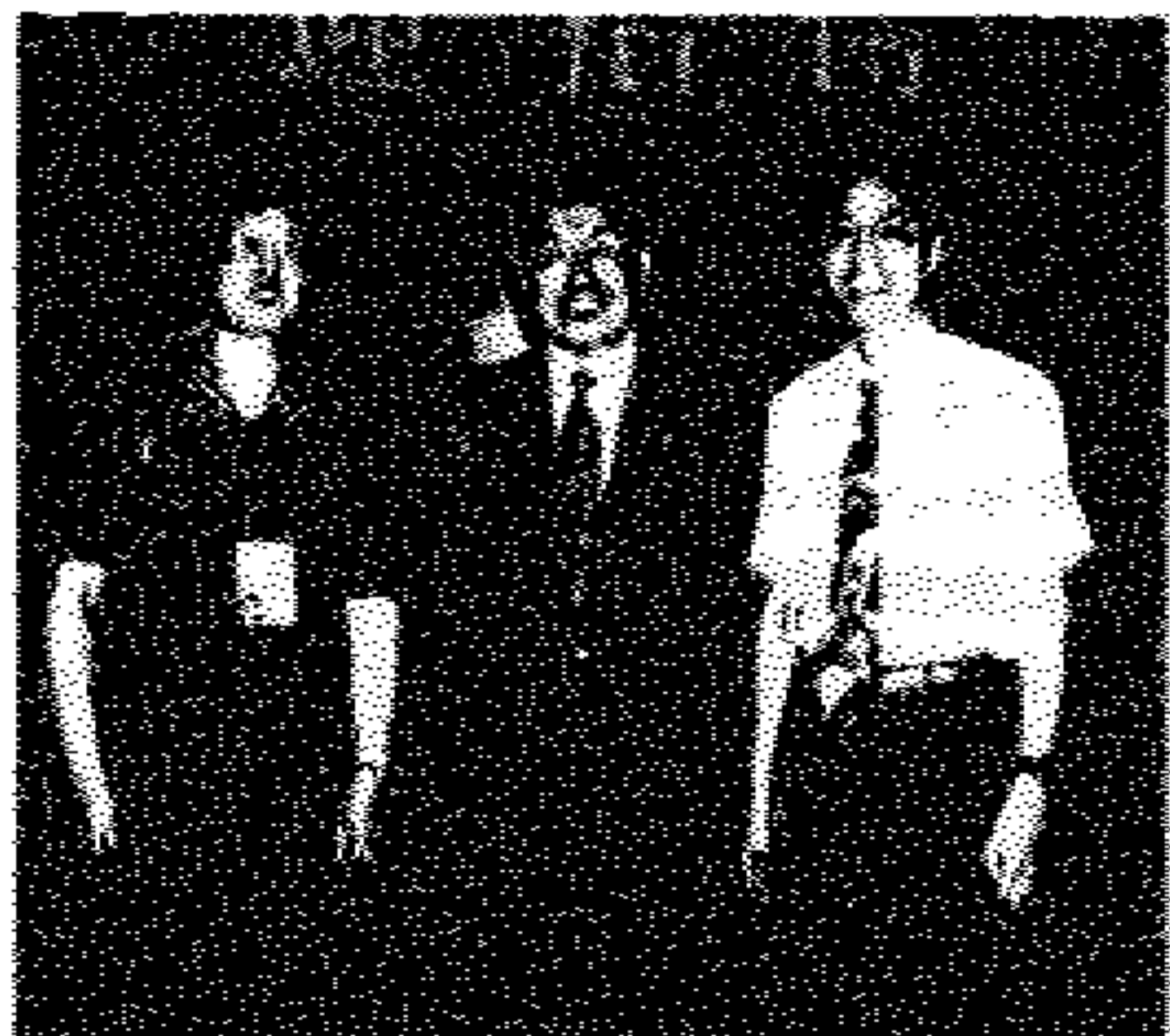
协会部分代表李允晨(左) 郑良根(右)会议期间与国务院侨办主任郭东坡(中)合影