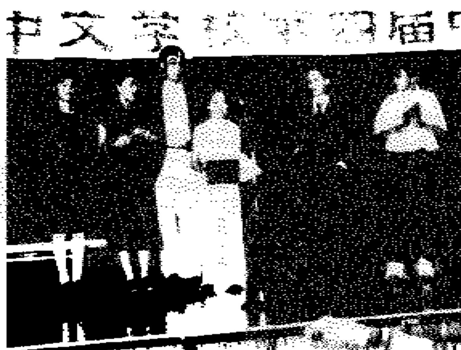
(上) 获得优胜的学生(部分)高兴的领取奖品