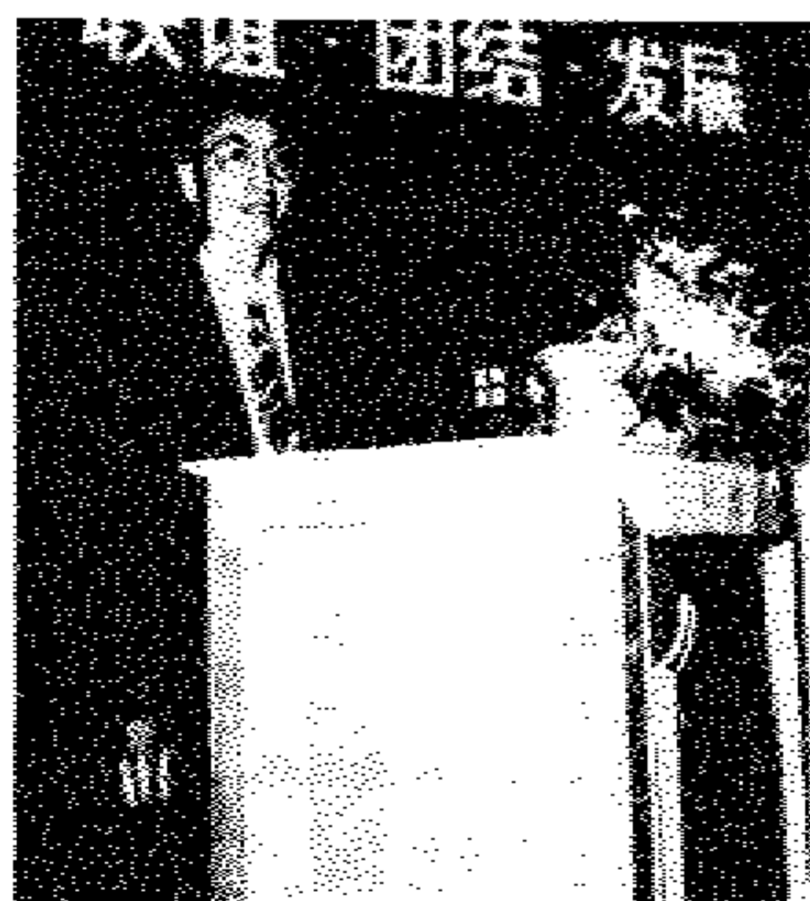
我协会代表在大会上作“总结经验，把握机遇，推进海外中文教育大发展”发言。收到普遍好评。