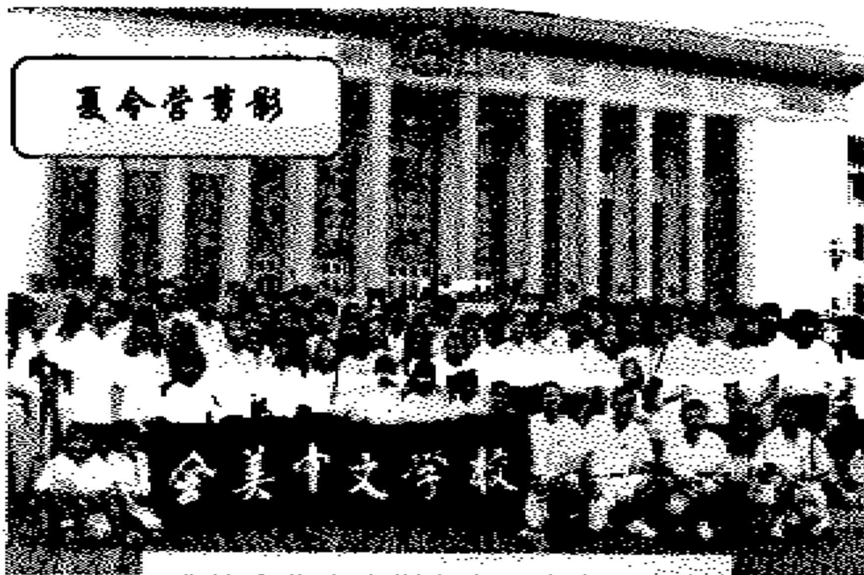
我协会北京大团在人民大会堂前

据国侨办官员介绍，从 27 日起，这 3000 名营员将在各地侨办的组织下，陆续离开北京，到各自的祖籍地寻根访祖。由国侨办统一组织，在京举行的联欢节至此也圆满结束。该官员透露，中国将继续保持“寻根之旅”的活动品牌，把这个活动办下去，但从明年起，具体的活动组织形式将会有一些变动。