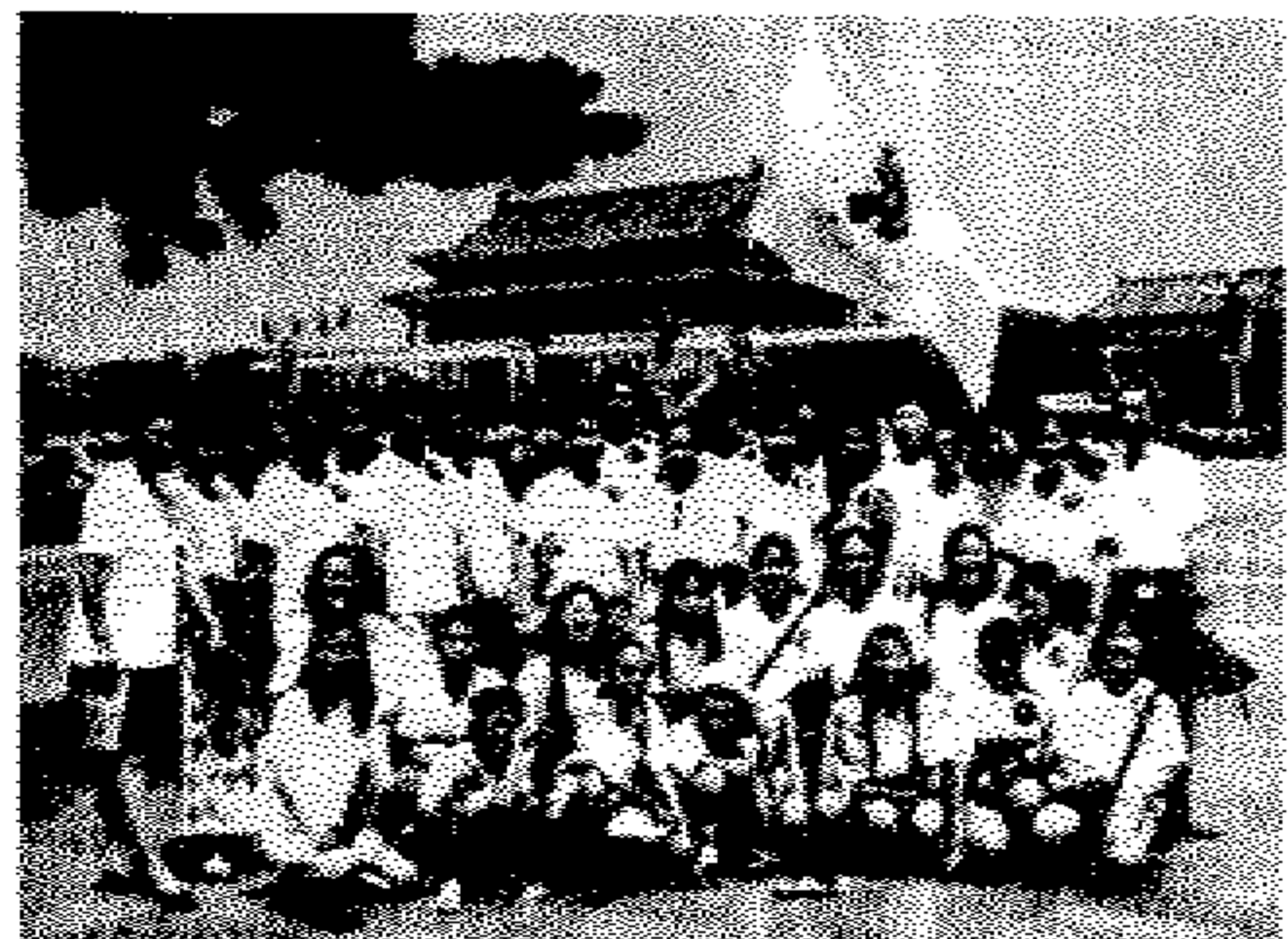
右图：我协会“荣誉学生代表团”在天安门合影