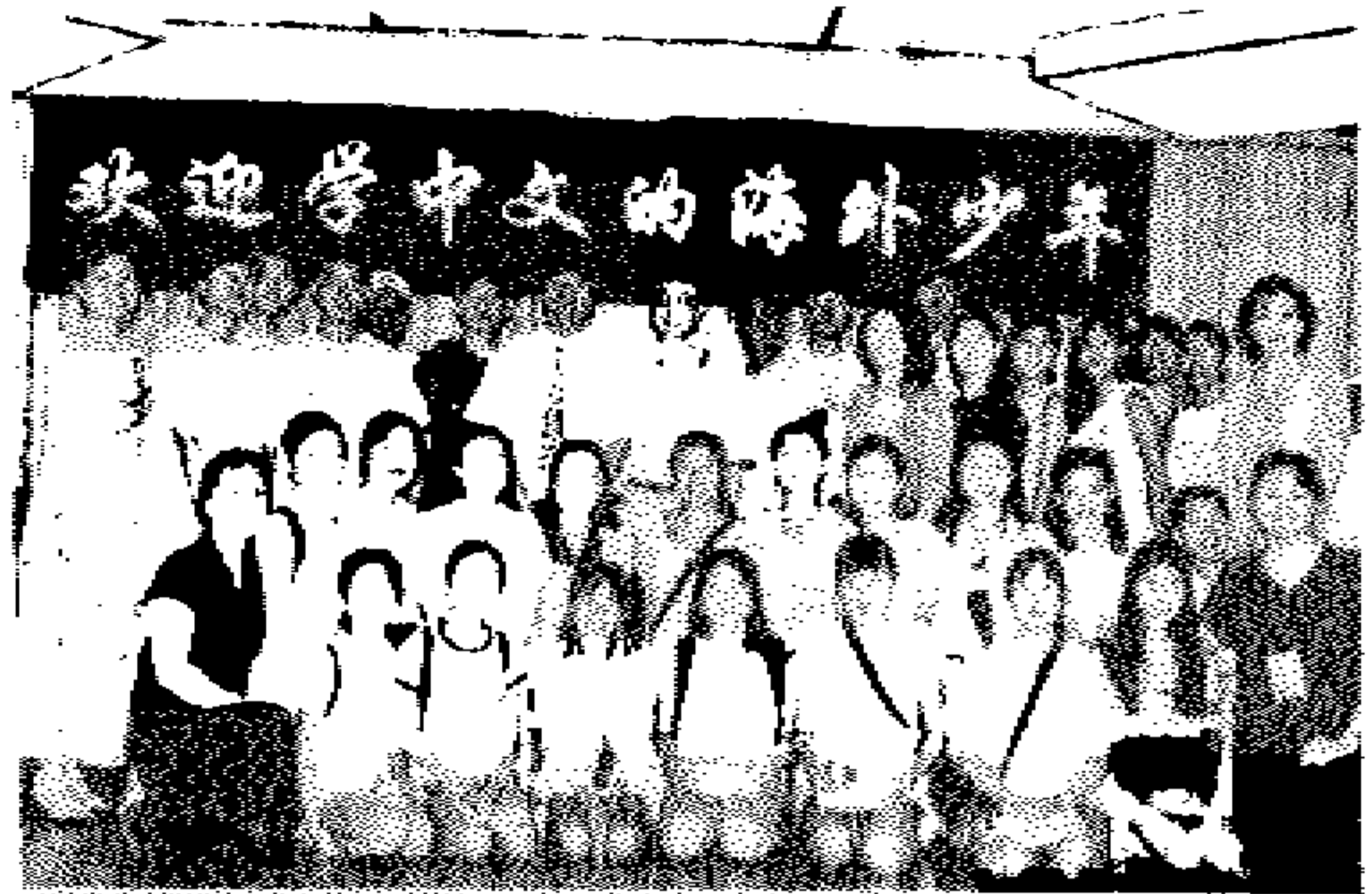
上图：我“荣誉学生代表团”参观人民日报海外版时合影