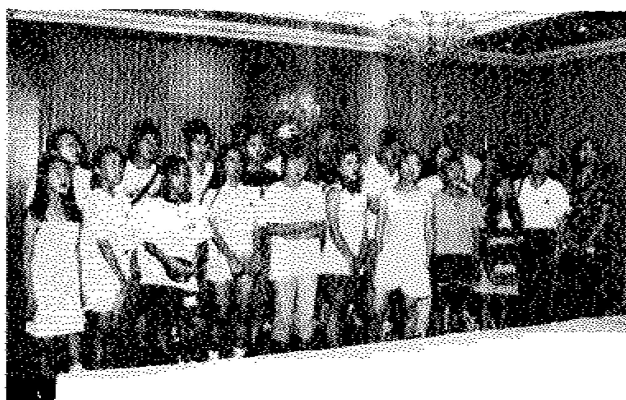
我协会参加北京夏令营团队之一