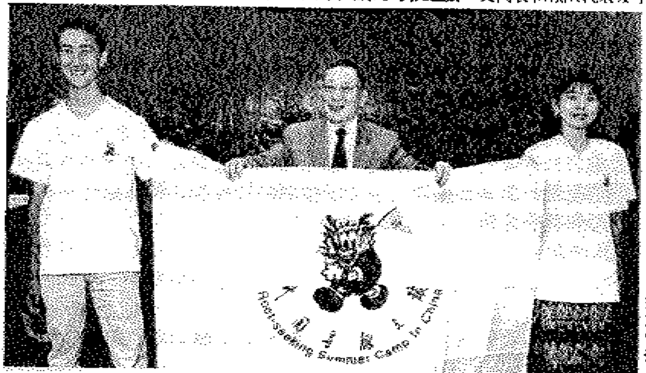
图为李岚清为寻根之旅活动授营旗。

开营式由国务院侨办主任、中国海外交流协会常务副会长郭东坡主持,全国政协副主席罗豪才及有关部门领导出席了开营式。开营式上,营员代表和领队代表发了言。