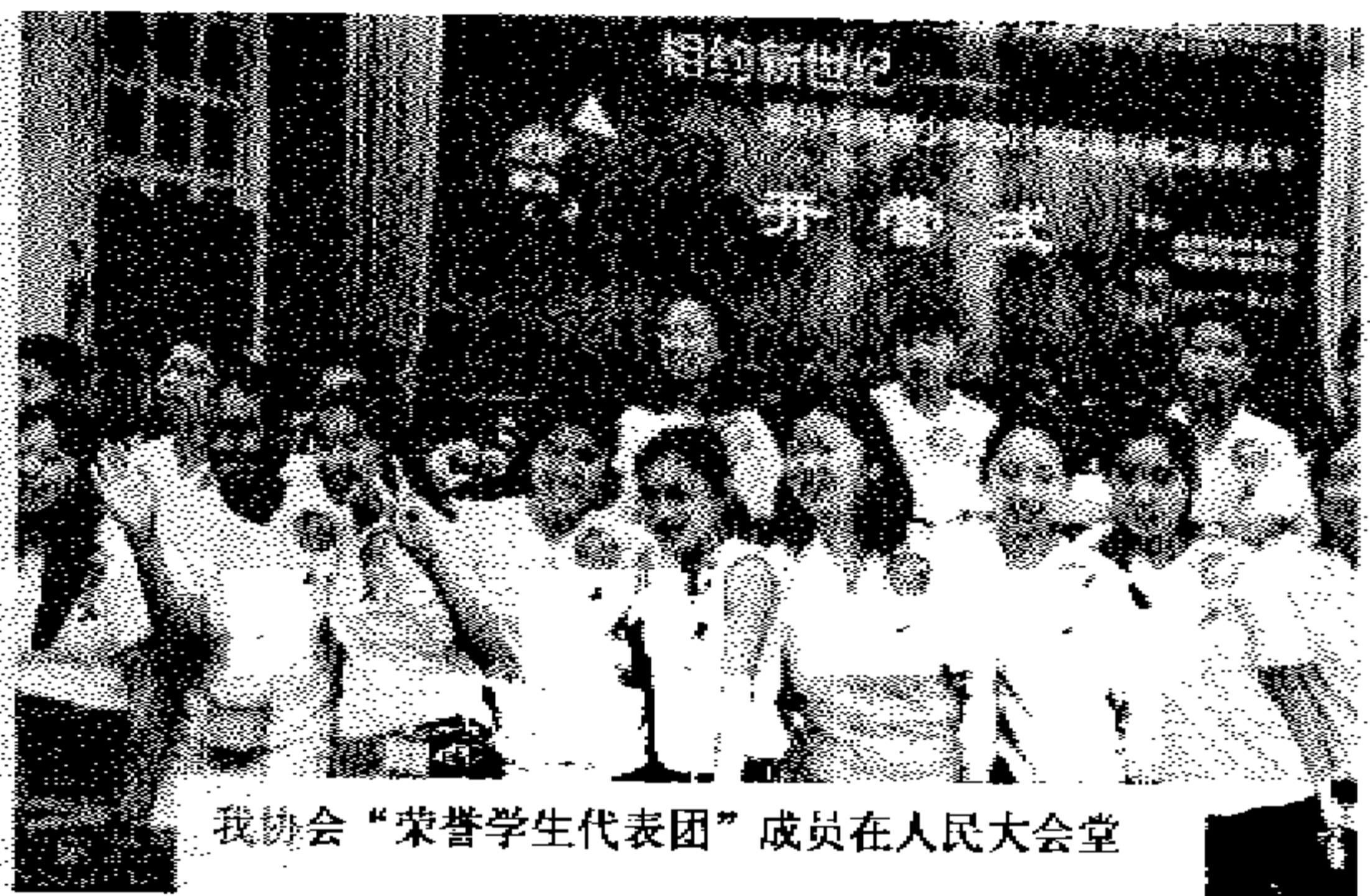
我协会“荣誉学生代表团”成员在人民大会堂

(实习记者田启林 7 月 26 日 报道) 海外华裔青少年寻根之旅联欢节今天上午在人民大会堂举行开营式, 国务院副总理李岚清出席并发表讲话, 开营式由国务院侨务办公室主任郭东坡主持。