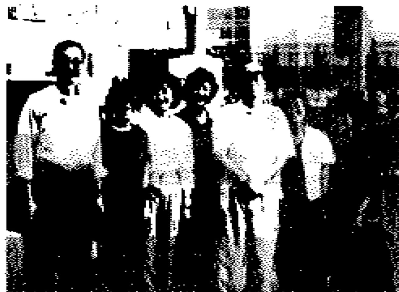
图为全美中文教学委员会部分委员 8 月份在 DC 会议期间

据悉,该建议书已经于 9 月初成文正式送交主管部门,Collegeboard 目前正在评估之中。