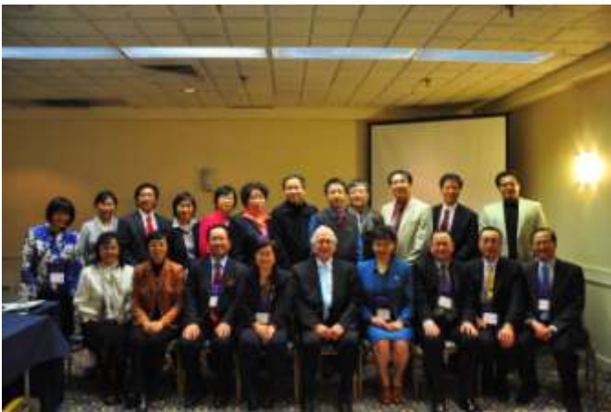
协会理事会，顾问和美国另外三大中文教育组织领导人座谈后合影