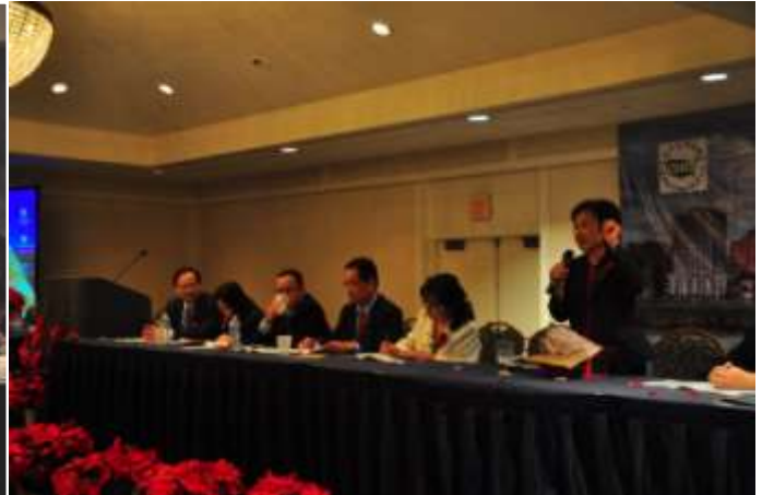
美国教育部前助理副部长张曼君作专题报告