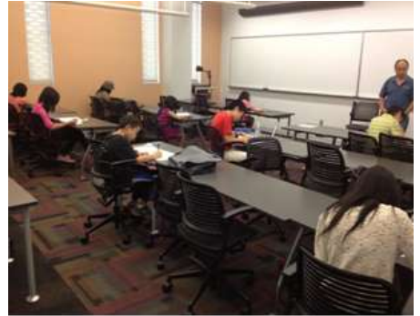
2012年海外中华文化知识大赛美国亚省现代中文学校考场。