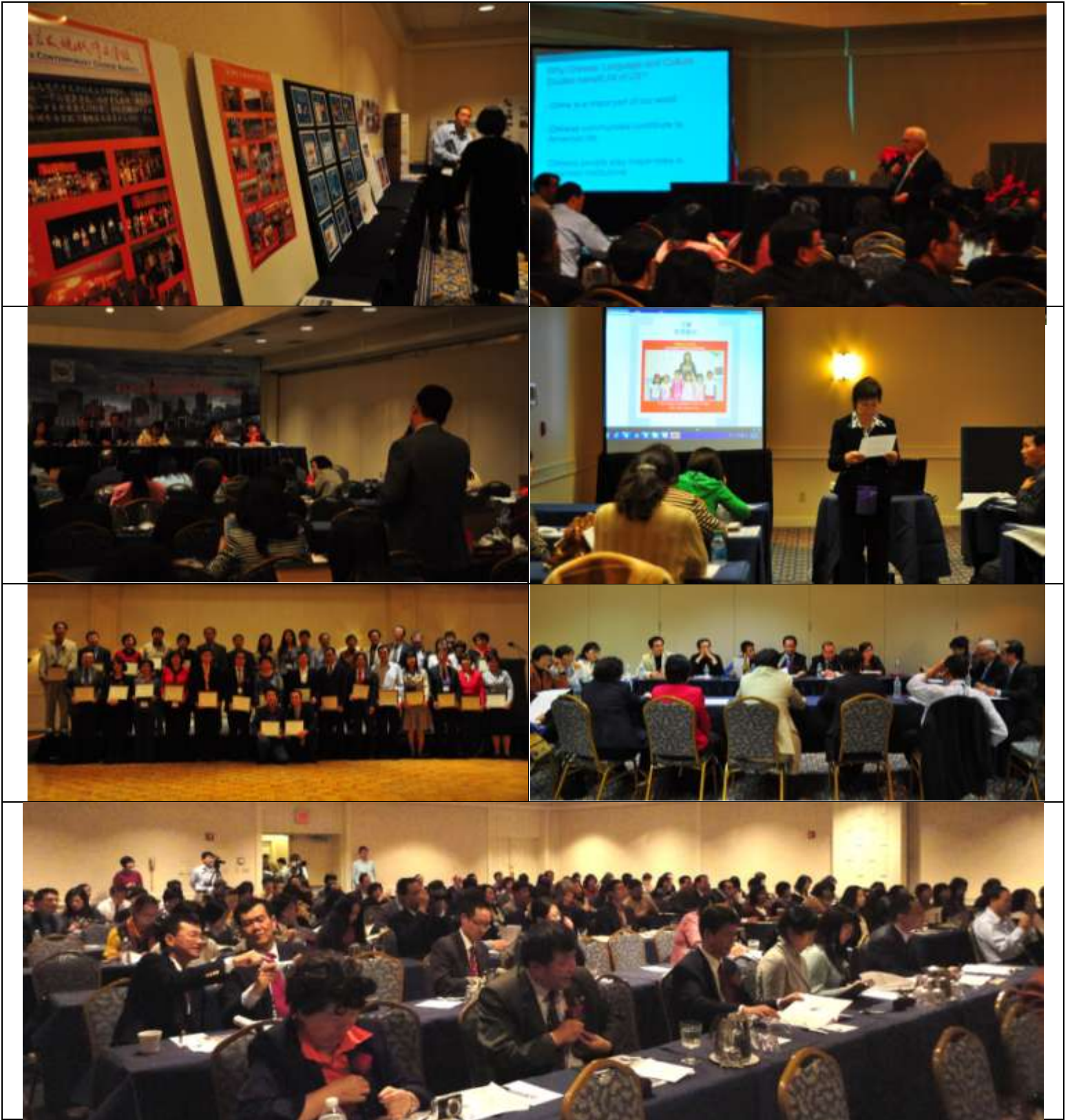
全美中文学校协会第九次全国大会暨华文教育研讨会照片：