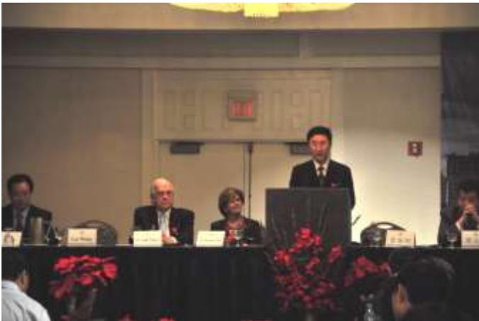
国侨办文化司司长雷振刚致辞