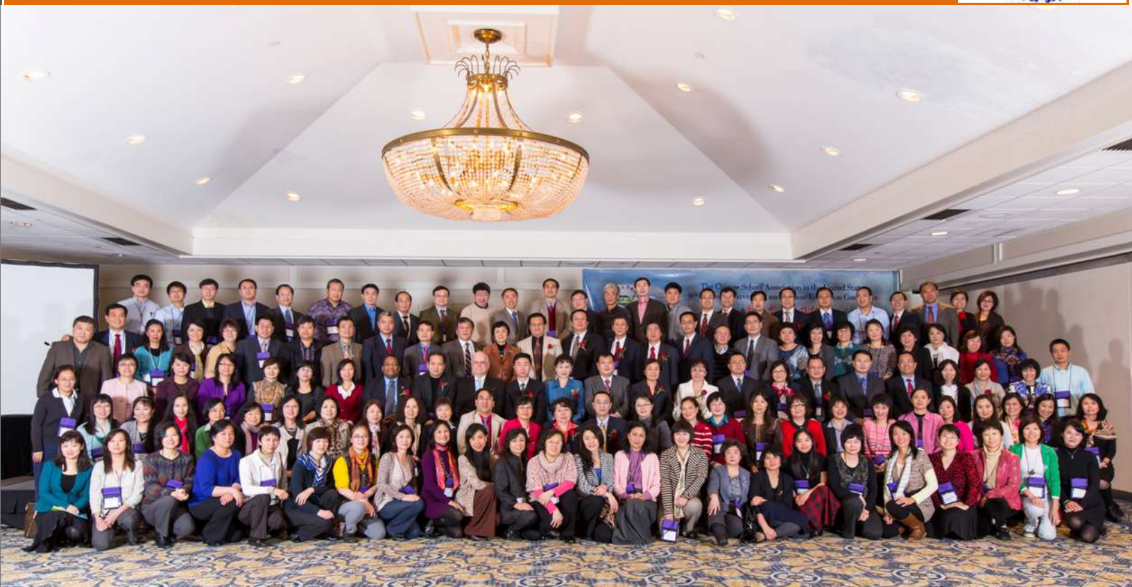
2012年12月7-9日全美中文学校协会第九次代表大会合影