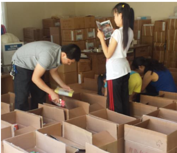
一边还在分发，一边就读入迷了

据悉，国务院侨办对海外华文教育支持的力度不断加强。类似的《华星书屋》工程下一批已经开始运作，可能在不远的将来还会有这样好事发生。