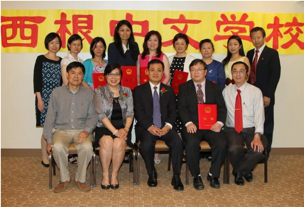
照片 2 出席颁奖仪式人员合影