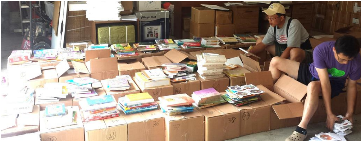
学校志愿工作者正在分发图书

【密西根中文学校协会消息】中国国务院侨办大力支持海外华文教育，从 2013 年开始，经全美中文学校协会筛选推荐 10 所会员学校新建《华星书屋》。密西根新世纪中文学校为其中之一。最近，这批图书终于全部到位，由密西根中文学校协会统筹，分发给所属 7 所中文学校，即 7 所学校都建立了期盼已久的《华星书屋》！其中，新世纪中文学校 2002 年就得到过《华星书屋》赠书，原有图书连续用了 10 多年，既破损又老旧，正为书源发愁呢，这下子鸟枪换炮了。