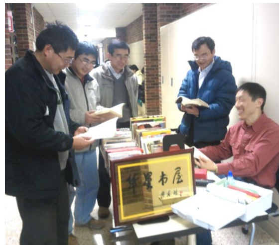
新世纪中文学校很高兴《华星书屋》得到充实，鸟枪换炮了。