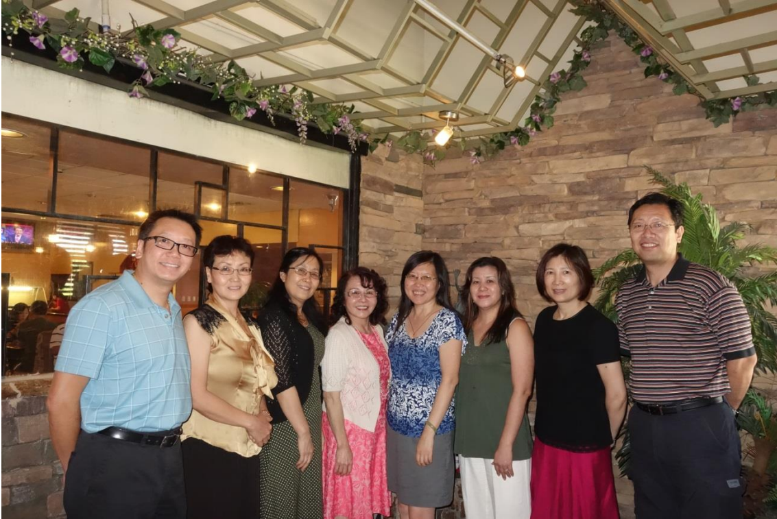
照片说明：凤凰城地区中文学校负责人聚会交流