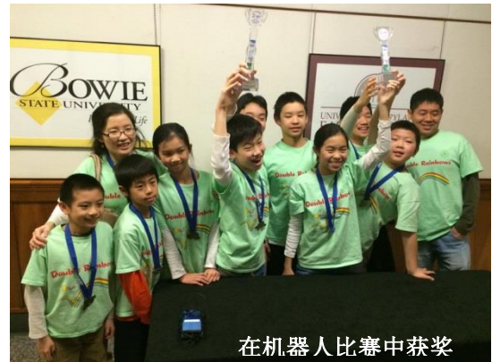
在机器人比赛中获奖

2013 年 11 月 2 日，哈维中文学校与 Howard County Public School System（以下简称 HCPSS）共同签定了教育合作伙伴关系的协议。哈维中文学校承诺，帮助 HCPSS 完善中文课程设置，建立中文教师队伍，提供文化交流，帮助文档翻译。HCPSS 则为哈维中文学校敞开信息交流渠道，包括家长及社区教育计划，规范化教学指导，成为公立学校教师资质要求和最为大家所关心的 GT Program，并寻求为小学提供课后中文教育的可能性等等。这次与 HCPSS 之间的强强联合，意味着哈维中文学校获得了一次巨大的飞跃，在本地教育系统占据了无可撼动的一席之地，再度提升了哈维中文学校在当地的影响力和知名度，从而为打造名牌学校提供了强有力支持。