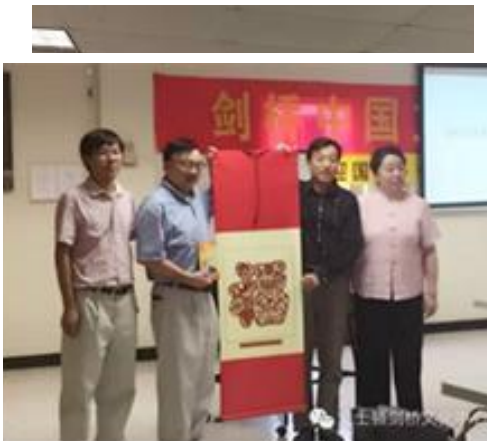
海外华文教育名师巡讲团总负责人国务院侨办王匡廷（右4），美东巡讲团负责人北京市侨办李德广（右2）向中心赠送纪念品

波士顿剑桥中国文化中心微信平台综合消息：由中国海外交流协会和国务院侨办文化司主办，全美中文学校协会承办的《海外华文教育名师巡讲团》，8月23日在波士顿剑桥中国文化中心开讲。来自大波士顿地区的近60名中文学校、公立学校的教师，以及有志成为中文教师的市民，还有中文学校的管理人员以及家长，参加了这次国内名师的授课。