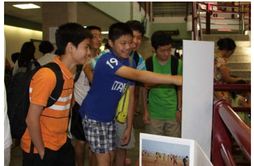
哈维中文学校的学生们观看夏令营海报。

经过十几年的发展，哈维中文学校已不仅仅是一所中文教育的学校，更成为一所多功能、全方位的学校。它利用自身资源，发挥优势，开发孩子智能潜力，开办公立学校遗漏或缺乏的科目。在文化教育方面，积极与国内联系，连续两年组团开展“海外华裔青少年寻根之旅夏令营”。让孩子们在增强对中国文化了解的同时，也促进中文学习的积极性，为推动海外华语教育尽一份绵薄之力。