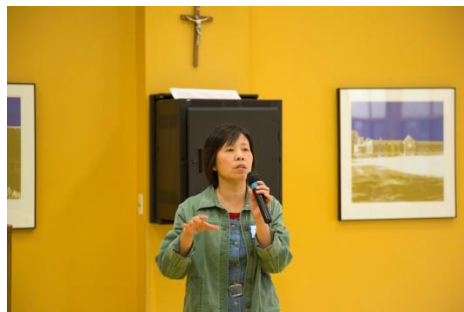
明华中文学校关力争教务长讲话