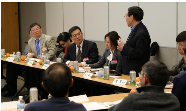
摄影：何国鸿、向建鸣 -- 2015年03月11日 --