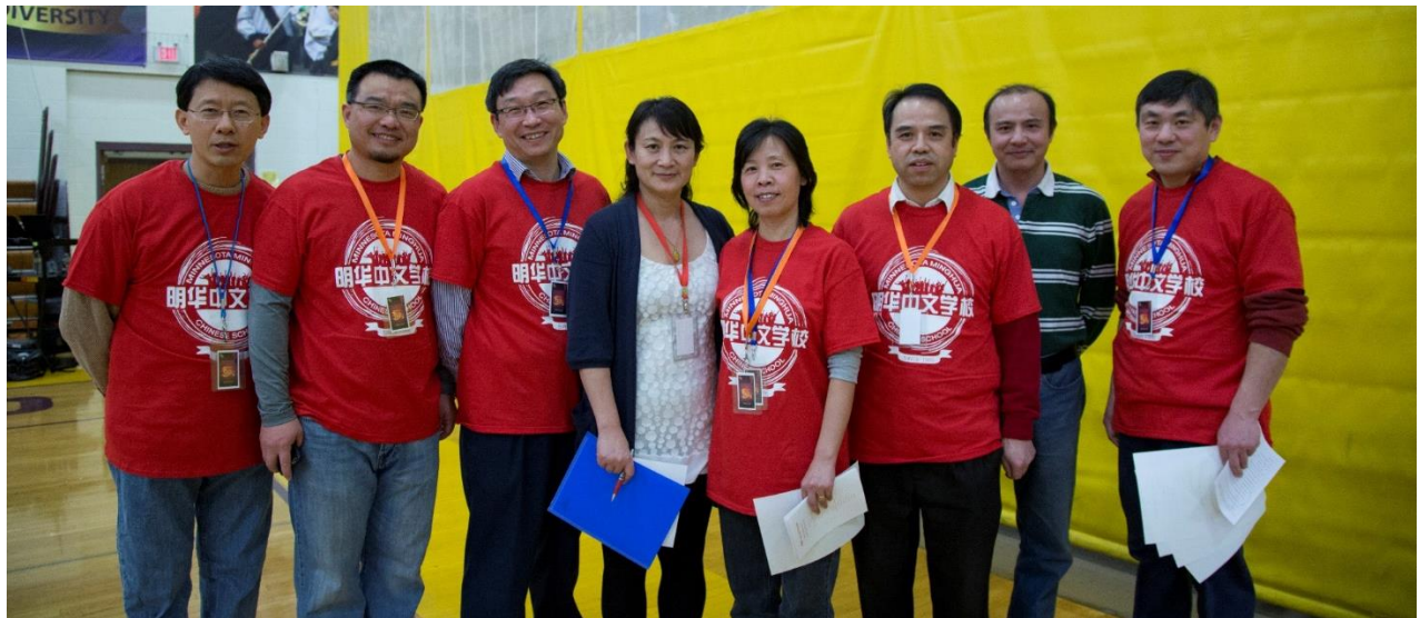
（明尼苏达明华中文学校供稿）