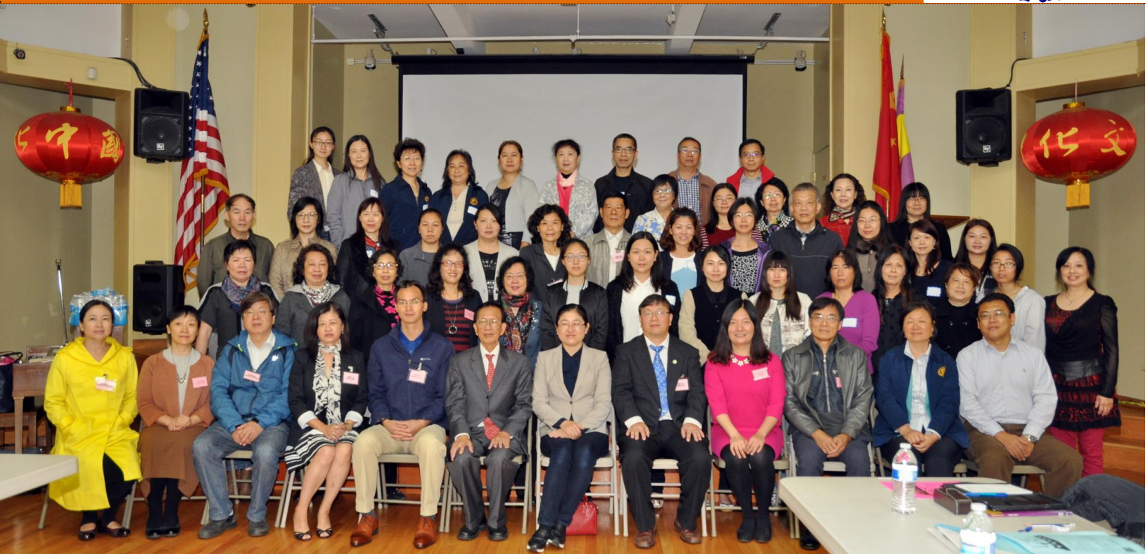
名师巡讲--南侨中文学校行