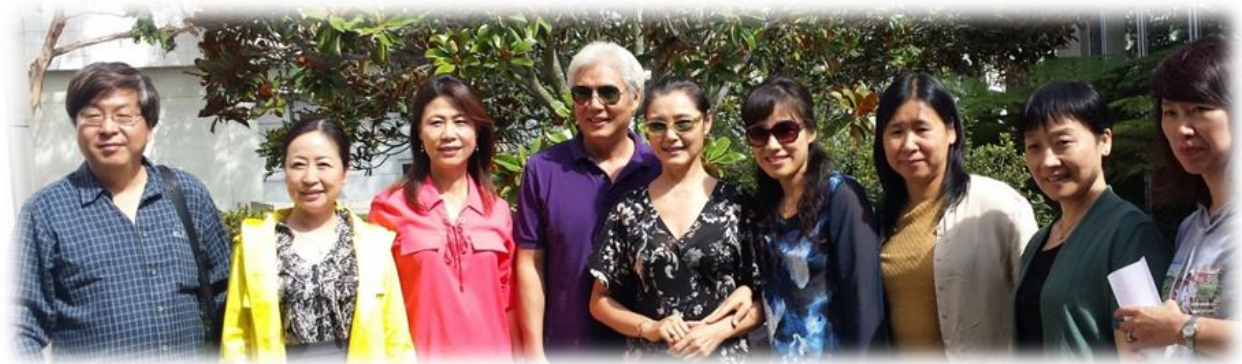
姜黎黎、汪宝生伉俪与老师们合影

在长达六个小时的讲座中，阶梯演讲大厅里座无虚席。慕名从一百多英里外的河滨中文学校赶来的著名表演艺术家姜黎黎、汪宝生伉俪也和与会的老师进行了交流。听众们纷纷表示，这次的教师培训班再次给海外华文教师提供了学习和交流的机会，实在是受益匪浅，希望以后能有更多这样的活动！