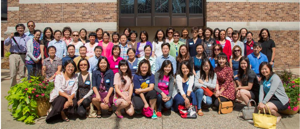
明华中文学校 2016 年海外中文教师培训合影

2016年8月21日在明华中文学校，中国海外交流学会派出的海外中文教师培训团进行了一场高水平的培训，参加学习的老师共计70余人。