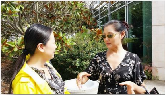
著名表演艺术家姜黎黎女士在与丛琳丽老师交流教学心得

活动中也可以选一些浅显易懂比较适合海外孩子的内容，比如上口的唐诗宋词来加强学生的学习兴趣，这样可能对教学会有更直接的帮助。