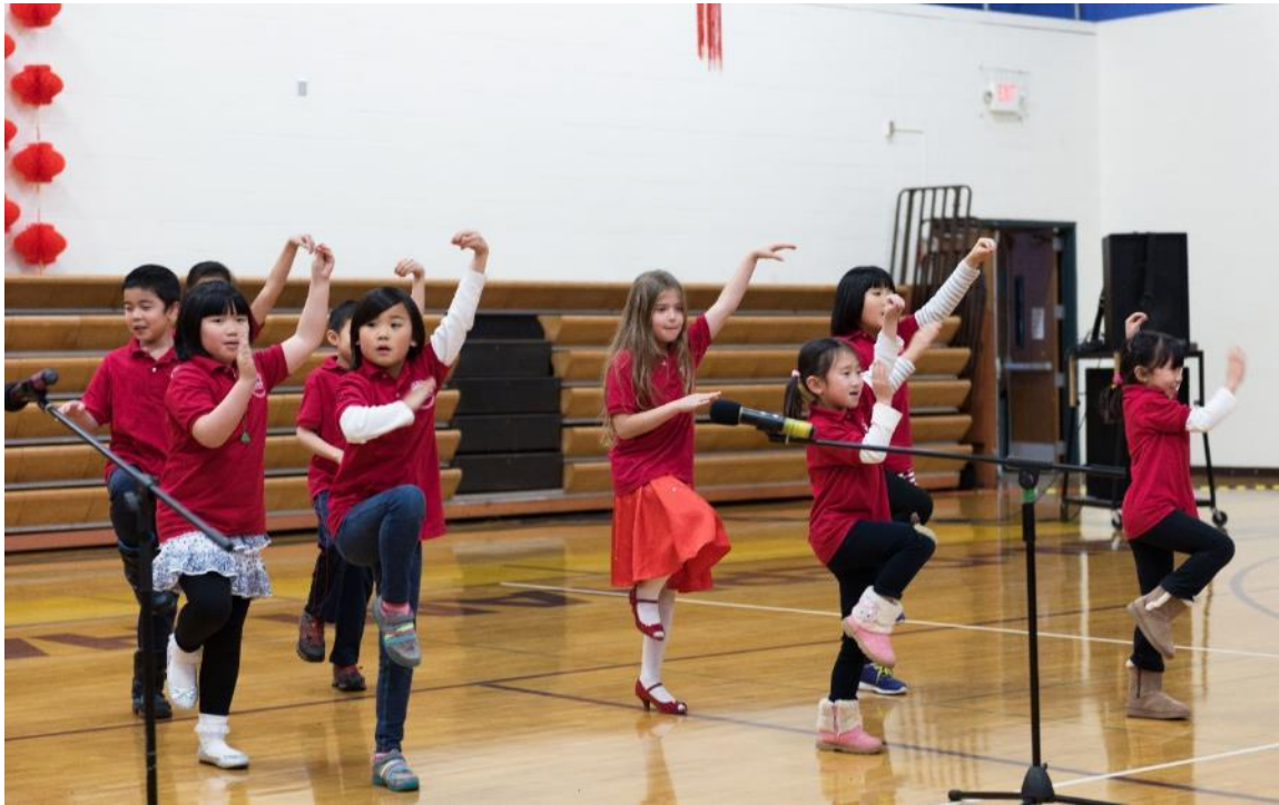
诗朗诵和功夫表演《咏鹅》