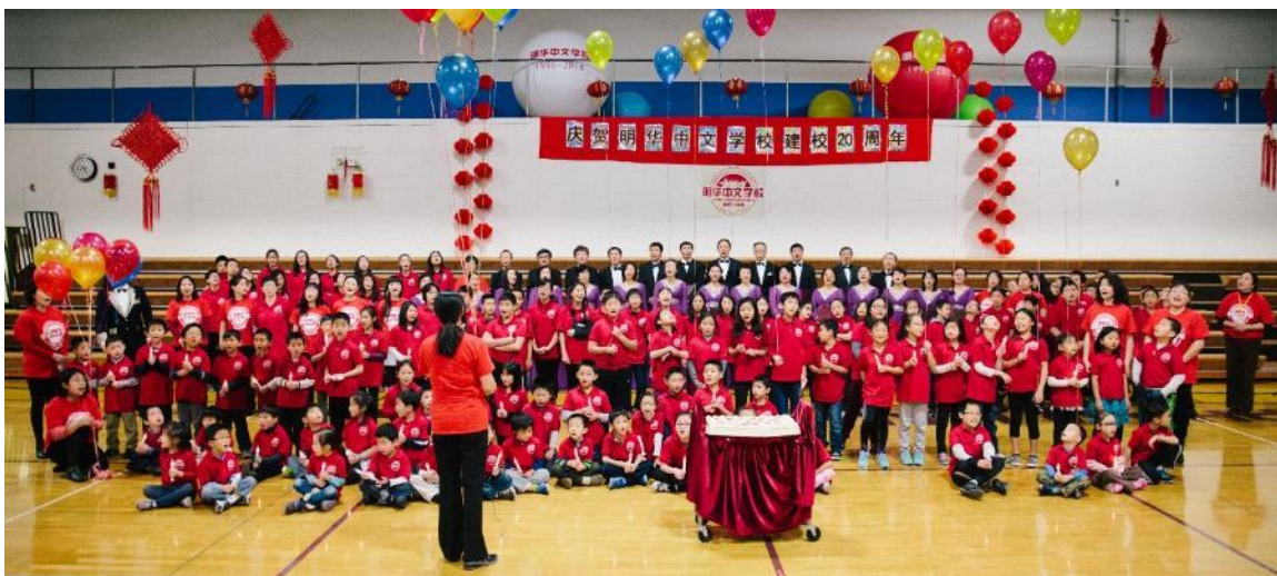
全场共唱《祝你生日快乐》

下午5点半，庆典活动圆满结束。此时，外面已是一片银色世界，明州今年入冬以来最大一场雪如期而降。中国古语“瑞雪兆丰年”说得真是好啊！今天，我们隆重庆祝明华中学校建校20周年，这漫天扬扬洒洒的祥瑞之雪，难道不正是我们学校在美国明尼苏达这片广袤的沃土之上，勤牛奋蹄、默默耕耘，构筑名校百年辉煌的最美好征兆吗！