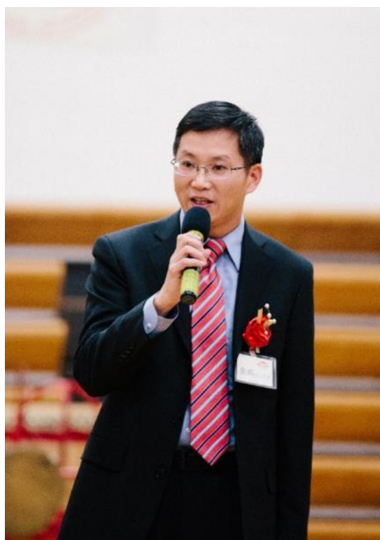
芝加哥总领事馆副总领事余鹏先生致辞