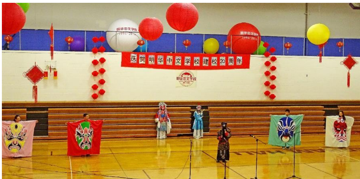
京剧联唱《贵妃醉酒》《红拂传》《铡美案》选段