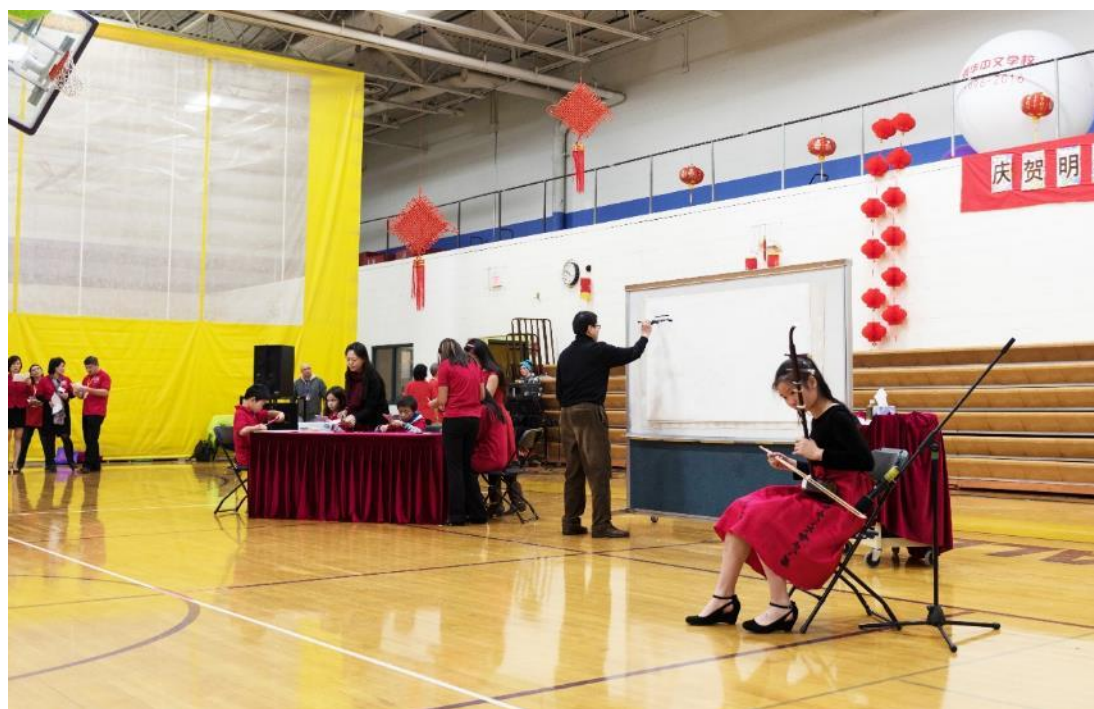
中国传统文化展示《汉风唐韵》