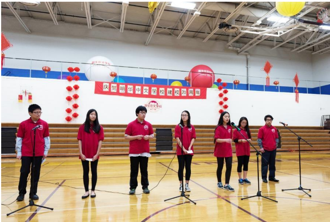
诗朗诵《心中的彩虹》