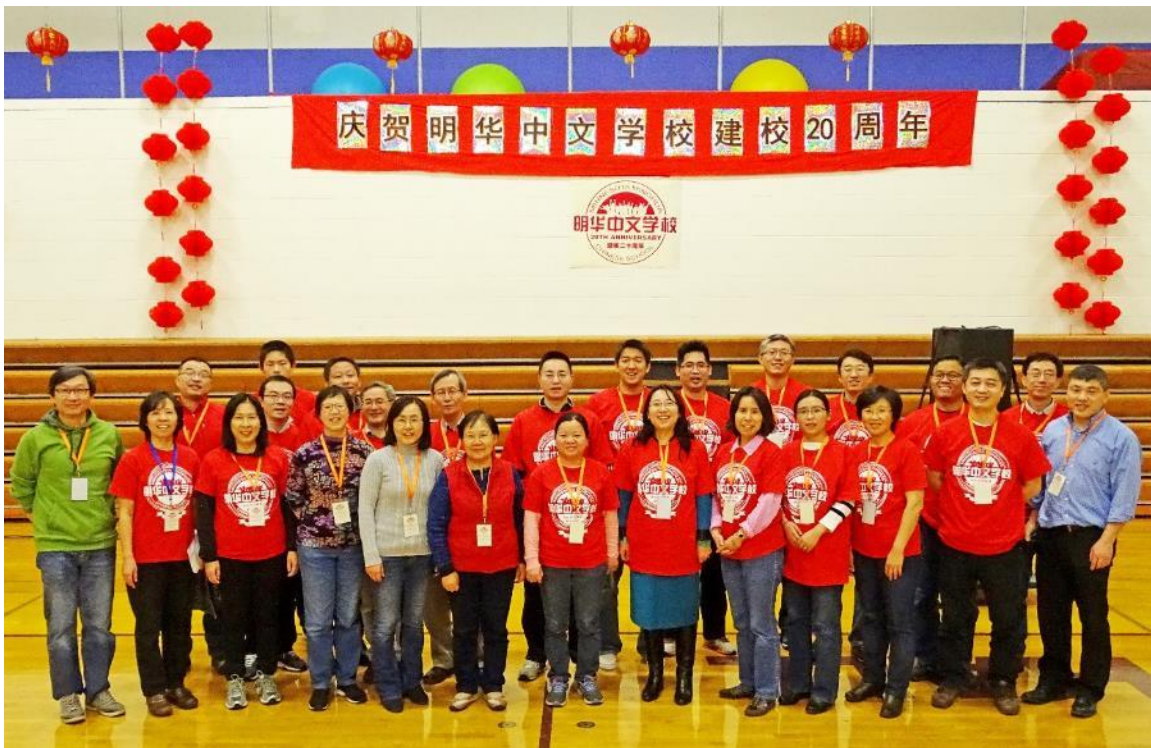
部分现场义务工作者合影