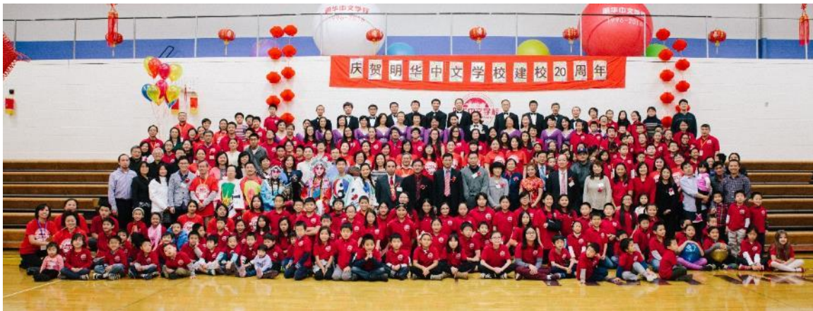
全体演职人员和嘉宾大合影