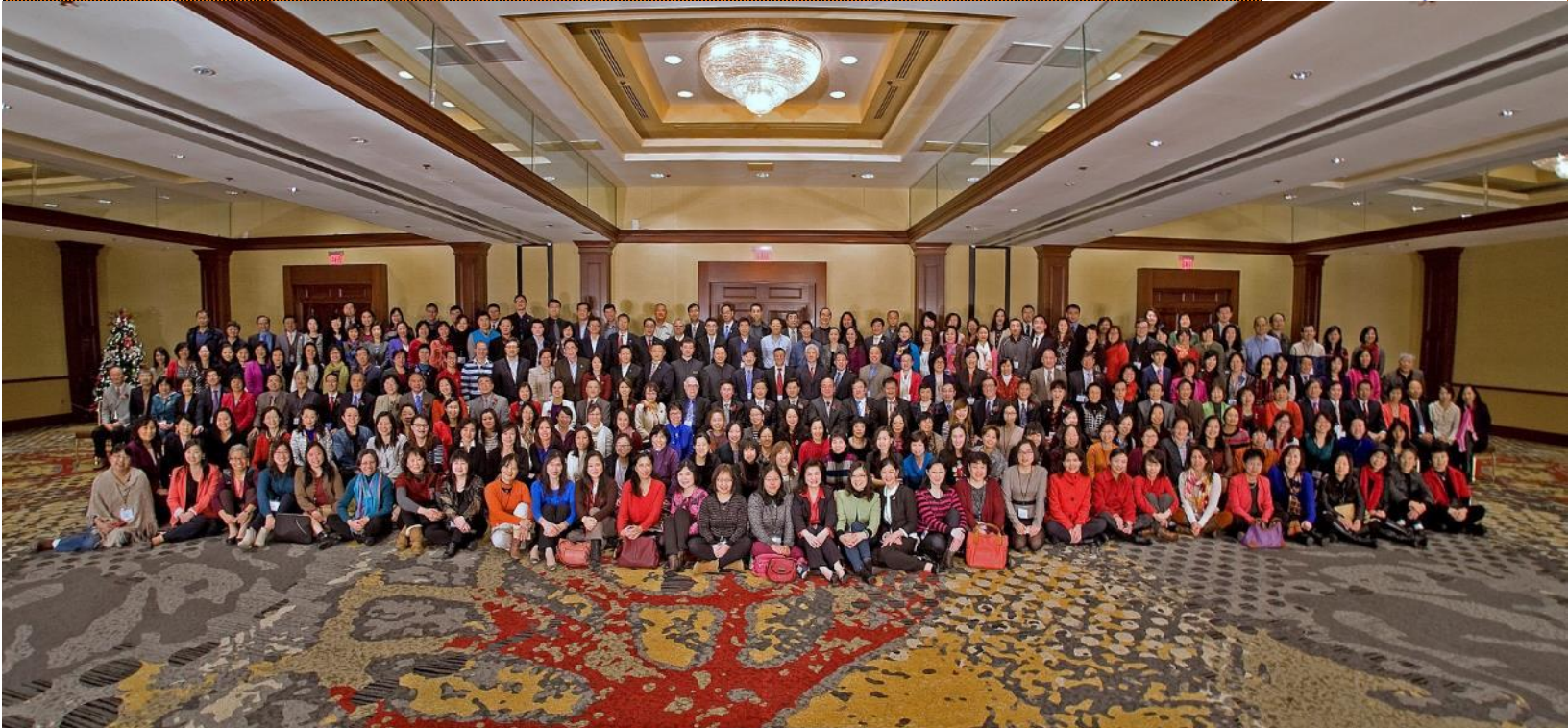
全美中文协会第十一次全国代表大会暨华文教育研讨会