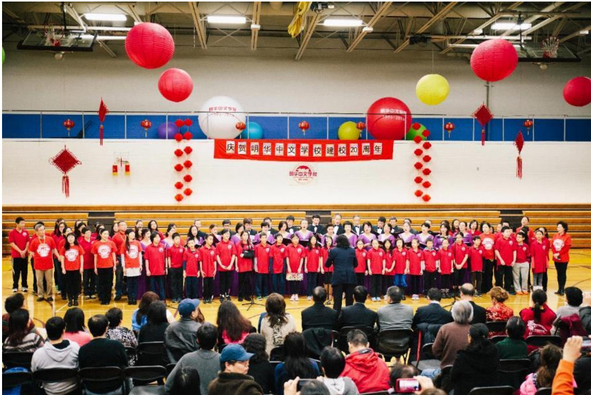
大合唱《明天会更好》《感恩的心》