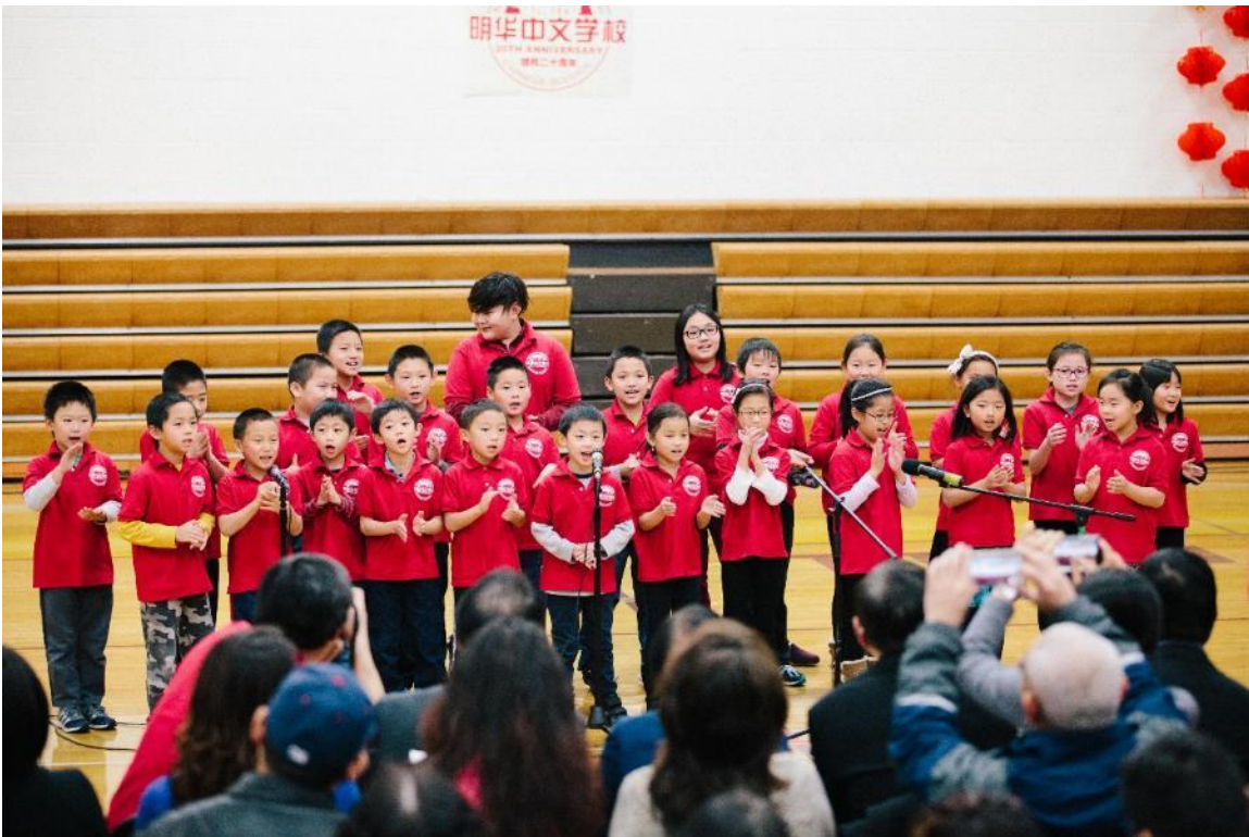
儿歌表演《中文学校是我家》