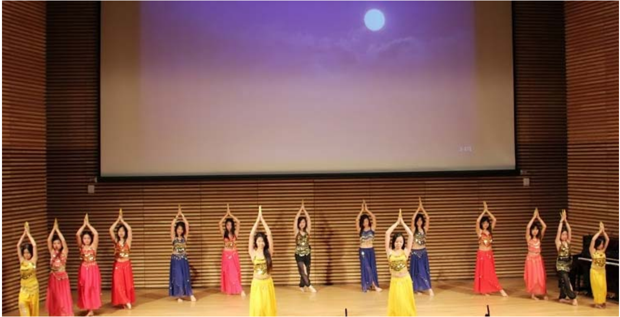
《安娜堡青少年中华文化才艺表演》----- 开场舞蹈：古典舞《月满西楼》

为庆祝安华中文学校建校二十周年，同时也为了给华人社区的青少年提供一个展示才艺，传承中华文化的舞台，地处密西根州大学城安娜堡（Ann Arbor）的安华中文学校与密西根大学孔子学院联合主办了《安娜堡青少年中华文化才艺表演》。