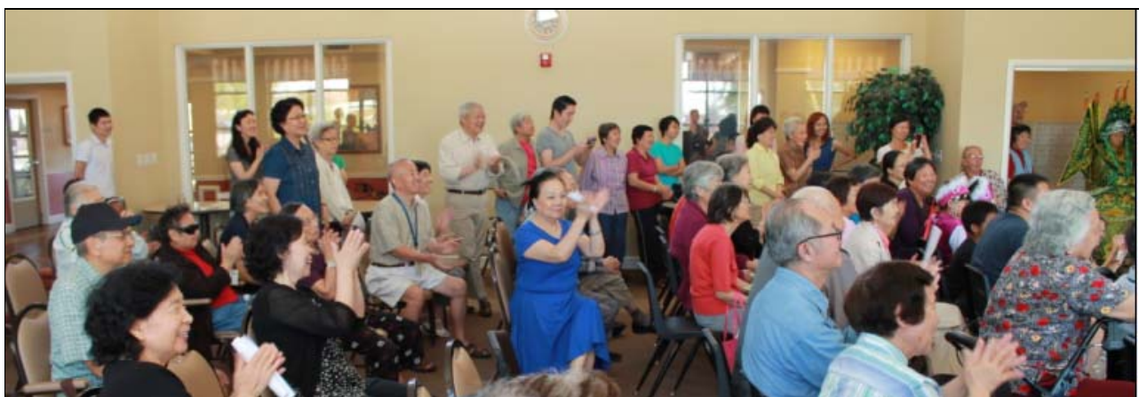
表演大厅热情的观众