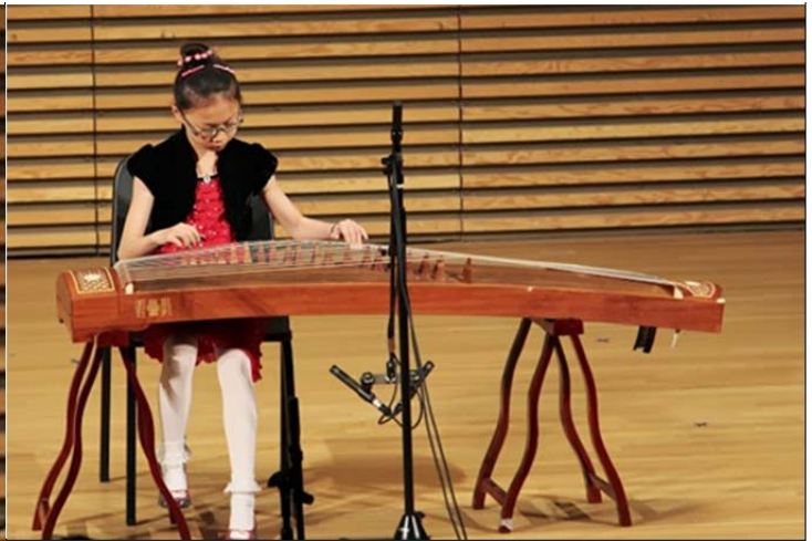
古筝独奏《孟姜女》《九九艳阳天》