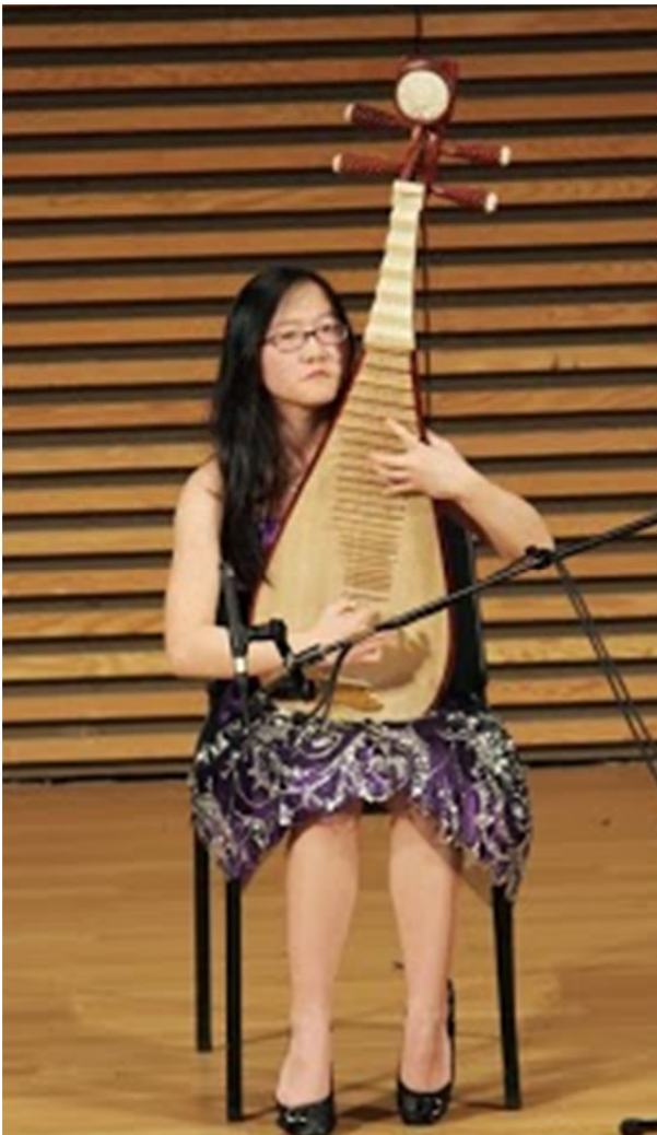
琵琶独奏《彝族舞曲》