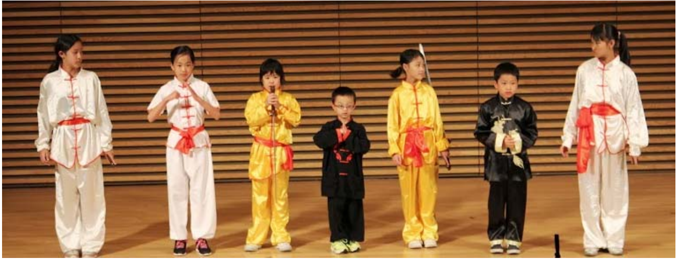
《安娜堡青少年中华文化才艺表演》-----安华武术班表演《中华武术》