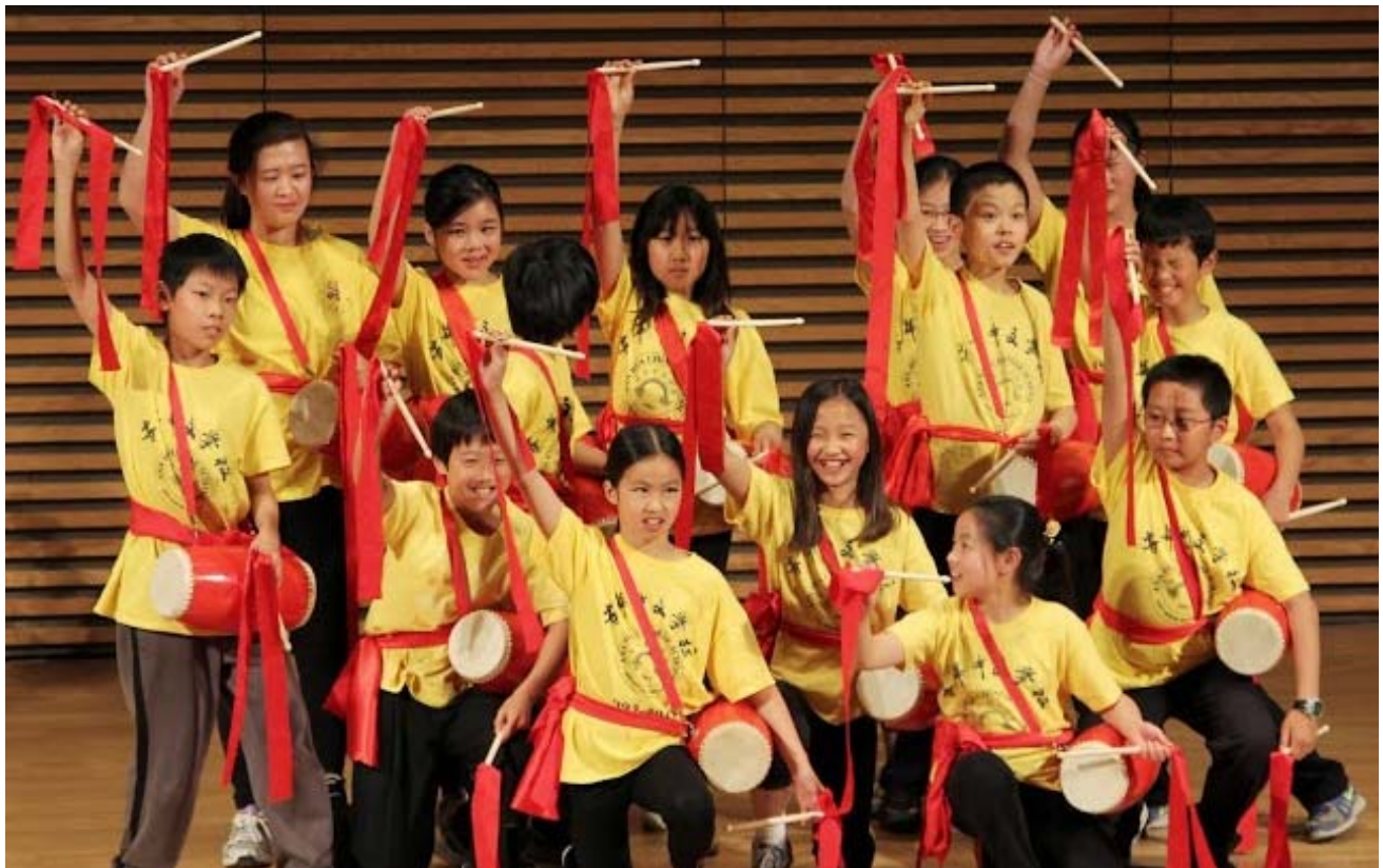
《安娜堡青少年中华文化才艺表演》----- 安华学生腰鼓队表演《西部腰鼓》