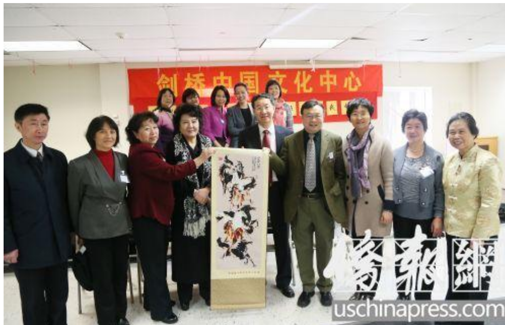
中国国务院侨办主任裘援平（前排左四）到访剑桥中国文化中心。

【侨报记者王昊2月17日波士顿报道】2月17日，中国国务院侨办主任裘援平一行访问波士顿剑桥中国文化中心，看望来自大波士顿地区的20余位侨、学、商界代表，并同他们就关心的问题交换了意见。