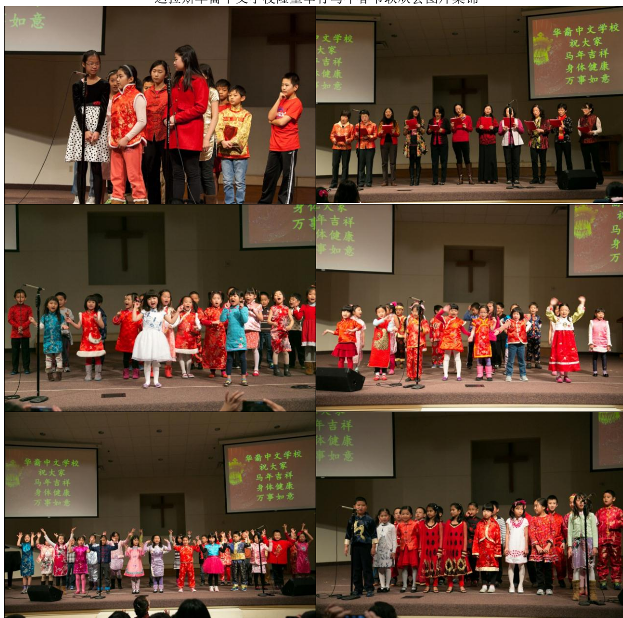
达拉斯华裔中文学校隆重举行马年春节联欢会图片集锦

各年级学生的精彩表演，高潮迭起，都充满了浓浓的中国风情，让各位老师和家长大开眼界。看来，孩子们在华裔中文学校不光学习有提高，他们快乐地成长着。联欢会在愉快热闹的红包发放中欢快结束。难忘今宵，难忘华裔春节联欢，让我们明年再相聚。