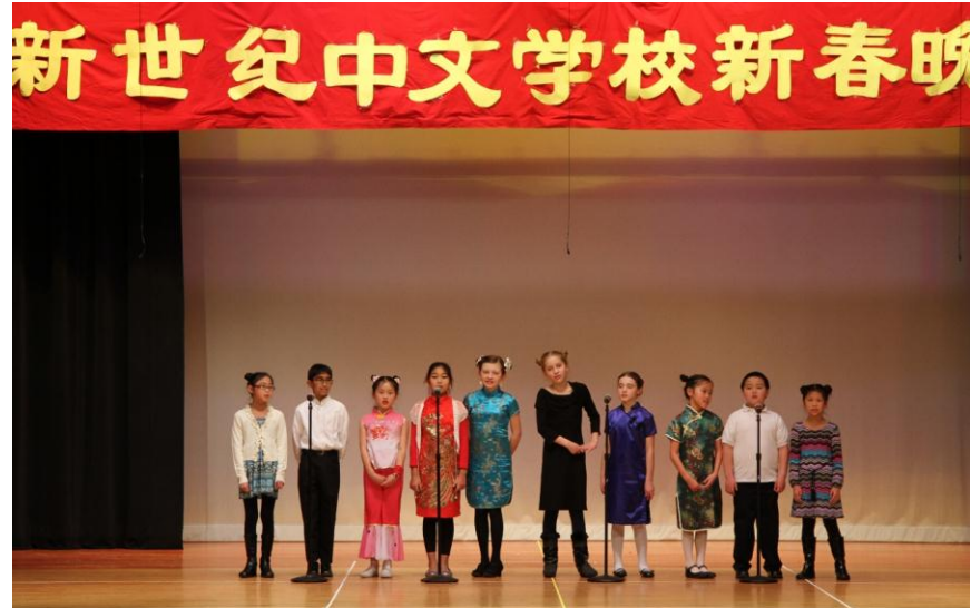
双语 5 班同学汇报表演

设计大赛获奖的同学颁发奖状和大红包。最后还评选出优秀节目奖，三个三等奖，两个二等奖，和一个一等奖，并颁发了奖状和奖金。和往年一样，凡是参加联欢会的同学都领到了红包。