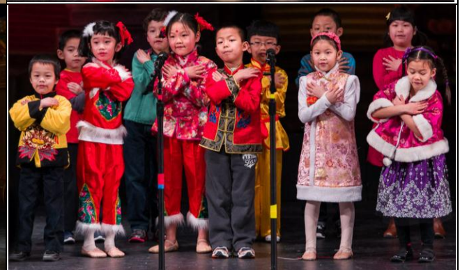
2014年俄亥俄第七届中国节组委会供稿