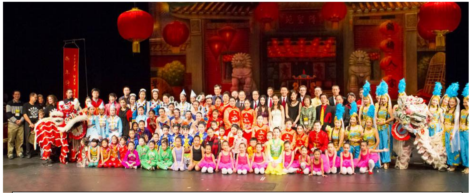
俄亥俄州第七届中国节嘉宾及演员合影