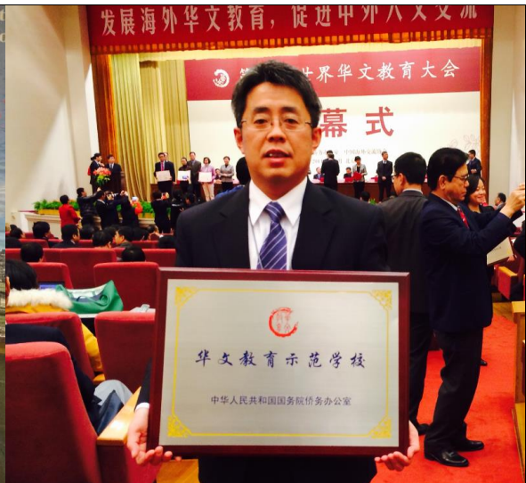
我校代表在全美中文学校协会第十次全国代表大会暨华文教育研讨会上的留影