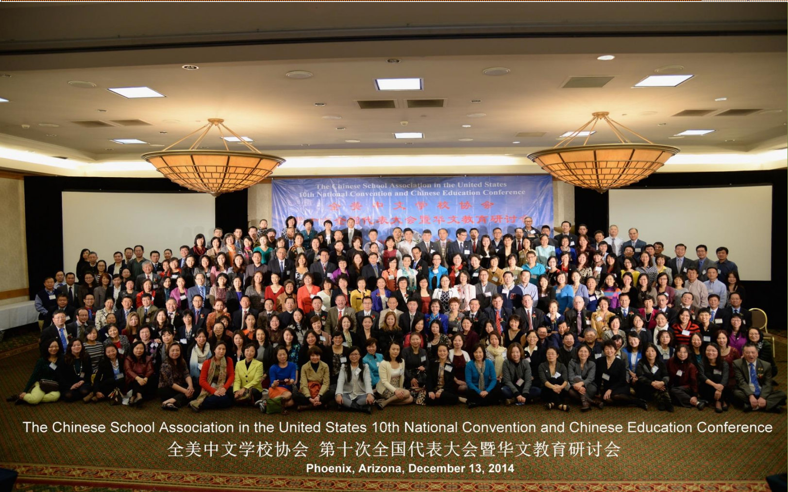
The Chinese School Association in the United States 10th National Convention and Chinese Education Conference 全美中文学校协会 第十次全国代表大会暨华文教育研讨会 Phoenix, Arizona, December 13, 2014