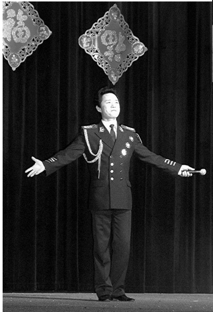
全美中文学校协会 季度通讯

全美中文学校协会 The Chinese School Association in the United States