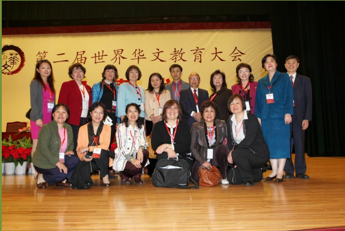
全美中文学校协会理事会代表及美国华校领导参加过侨办“第二届世界华文教育大会”