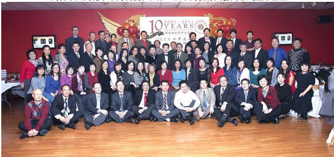
“俄州现代中文学校十年新历程”庆祝活动合影