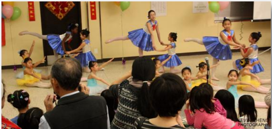
随着动听的音乐，舞蹈班的孩子们翩翩起舞，美不胜收