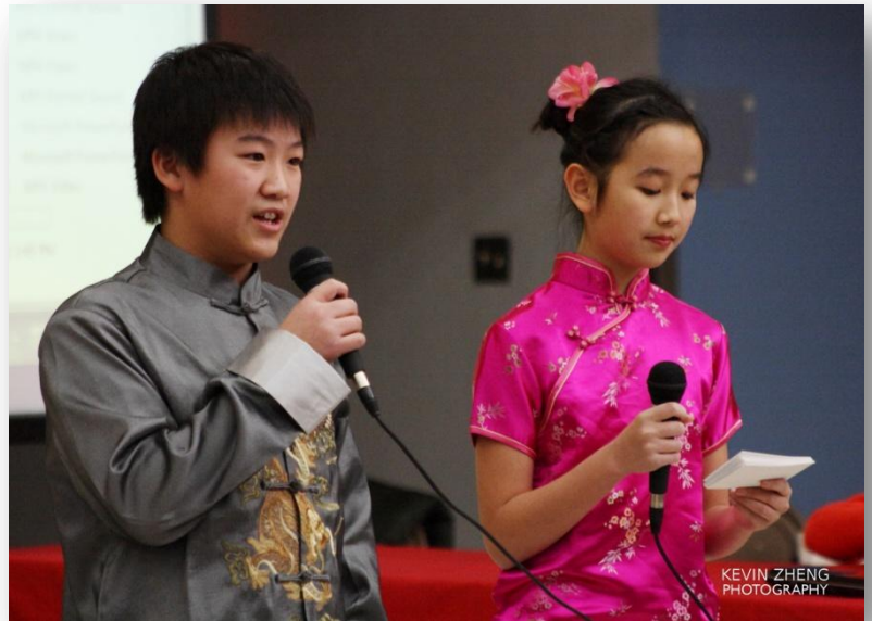
两位小主持人盛装出场

一月二十一日下午三时许，育才中文学校 2012 年春节联欢会在激昂的锣鼓声中正式开幕。像往年一样，今年的表演也以各中文班为主，每个班都推出了最拿手的节目。有的班出小合唱、诗朗诵；有的班级出谜语让大家猜；还有的班载歌载舞以及多种乐器小合奏。精彩有趣的节目让大家开开心心地度过了一个下午。