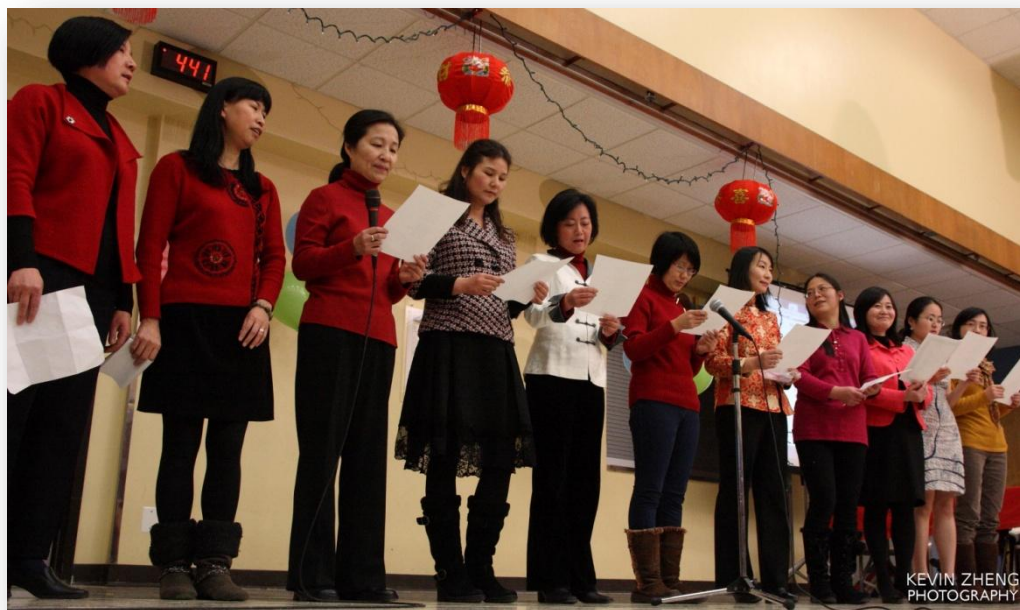
压轴好戏，全体教师合唱：难忘今宵