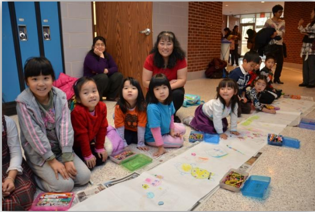
左上图为王红老师班

近日，在 CCCC A 克里夫兰当代中文学校的支持和艺术课老师地指导下，第一届百尺长卷绘画活动在中文学校火热举行。来自五个绘画班共计 60 多名同学把对生活的热爱和未来的憧憬尽情地挥洒在画卷上：淳朴的构思、和谐的线条、娇艳的鲜花、可爱的动物 …… 孩子们精彩的作画，吸引了许多家长和参观者的目光，她们纷纷举起相机拍下了孩子们作画的精彩瞬间，并和孩子们合影留念。