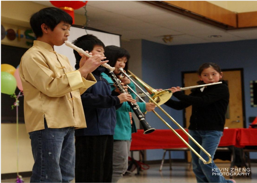
用西洋乐器演奏中国音乐，别有一番风味