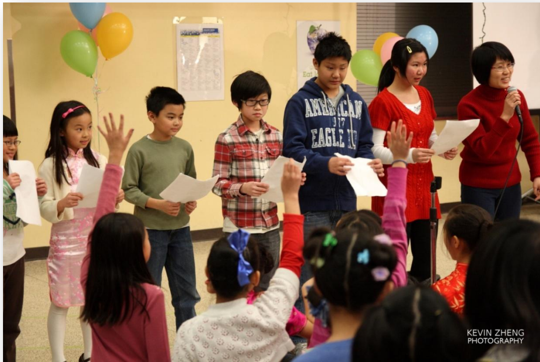
出谜语给大家猜，吸引了大家的视线