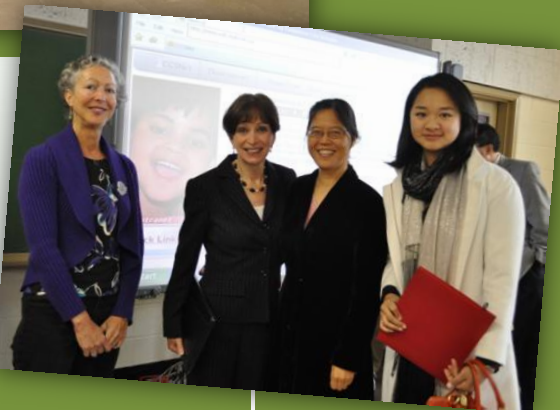
全美中文学校协会中西部教师培训研讨会集体留影