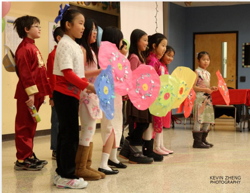
小朋友们手持花伞表演歌舞：下雨歌