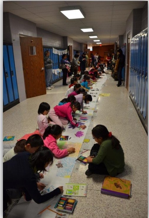
右下图为绘画百尺长卷