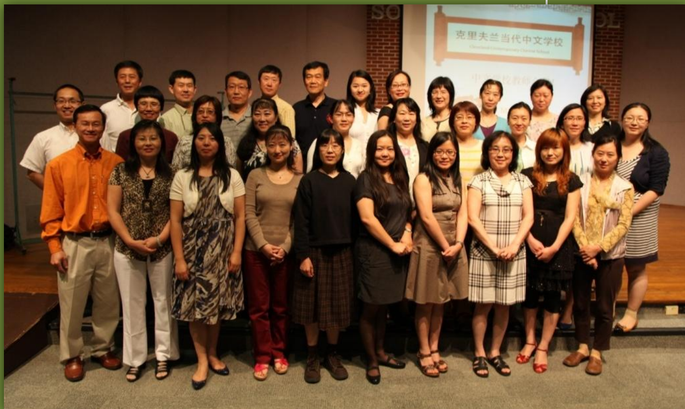
克里夫兰当代中文学校教师培训合照