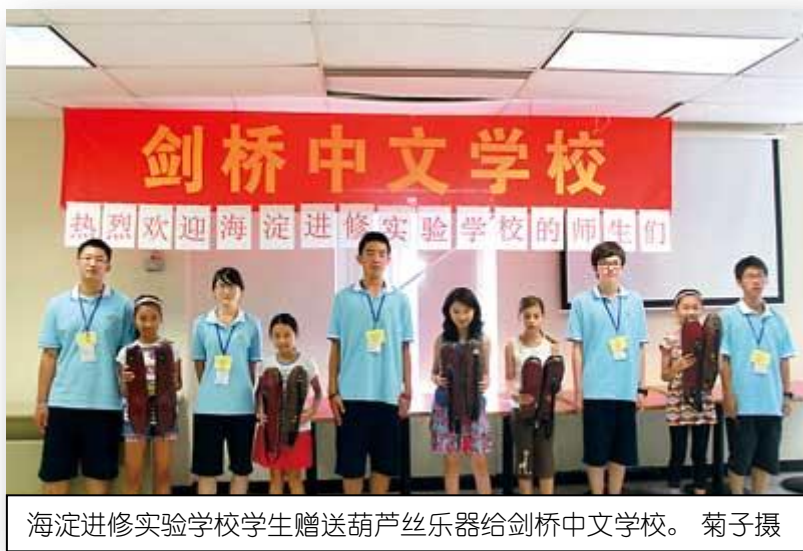
海淀进修实验学校学生赠送葫芦丝乐器给剑桥中文学校。

参观活动则包括参观州政府、议会厅、美国最古老的波士顿公园、波士顿第一大教堂、波士顿美术博物馆、儿童博物馆、自由径(Freedom Trail)、美国宪法号、哈佛大学碧波地(Peabody)博物馆、玻璃花博物馆、甘乃迪图书馆、五月花号帆船，打响美国独立战争第一枪的老北桥，以及哈佛大学、麻省理工学院、卫斯理学院等名校。离开波士顿，返回中国前，该团还将游览尼加拉瓜大瀑布、西点军校、游纽约看帝国大厦、时代广场，游华府特区，参观白宫，国会大厦等。