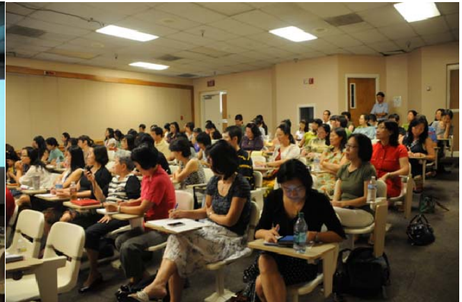
凤凰城地区培训课堂