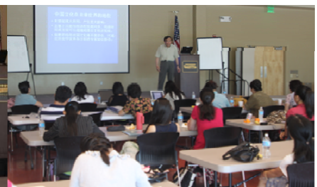
葛剑雄教授在图桑地区讲授“中国文化的复兴和建设”