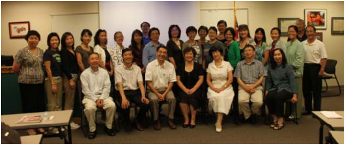
俄亥俄现代中文学校参加培训人员与讲学团教授合影

并在韩国和美国工作多年。通过多年的教学研究经验，他向大家介绍了外国学生常出现的语言错误，并分析了错误原因，例如声调、误写、误读、对文化的误解等。