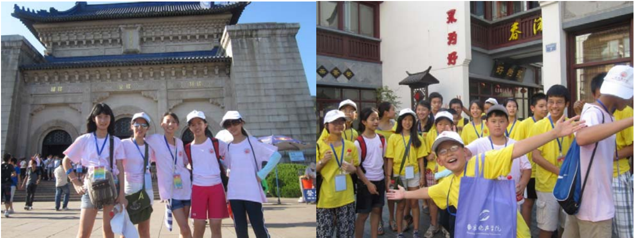
2012年江苏省侨办“金辉”夏令营美国队学生

本届夏令营虽然结束了，但带给我们美国队营员们的美好印象将长久地留在我们的记忆中。