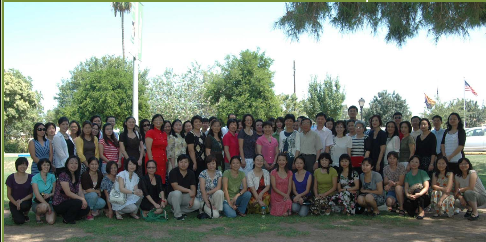
2012年8月亚利桑那凤凰城参加培训的华文教师与国侨办讲学团专家合影