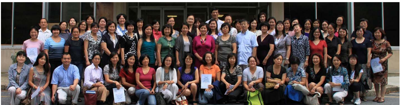
2012年8月费城地区参加国侨办讲学团“教师培训”活动的人员合影