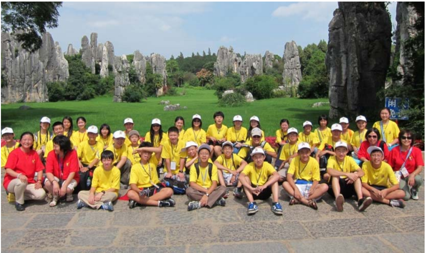
2012年国侨办在云南昆明举办的“第三届海外华裔青少年中华文化知识竞赛”优胜者夏令营

夏令营期间，我们游览野生动物园时，我拍了许多照片。其中有一张是一只熊猫正在悠闲地吃着竹子，没想到它给我提供了油画素材。回到美国后，我参加了每年一度的油画夏令营，正好用上了它。很多朋友看到我的油画作品后，都被大熊猫可爱、悠闲的样子所吸引。自然，他们也对我的云南之行羡慕不已。