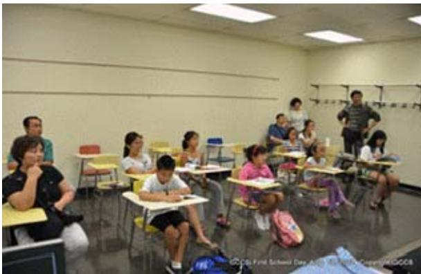
讲师团参观指导课堂教学