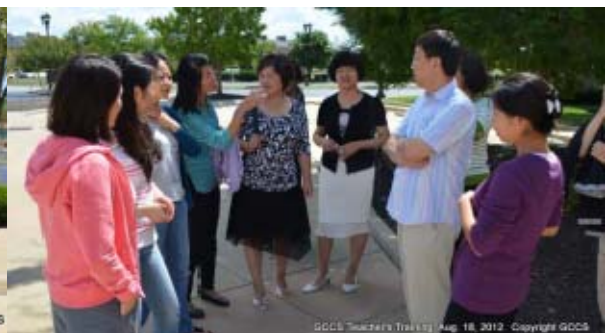
讲师团成员与大辛辛那提中文学校部分教师及志愿者合影