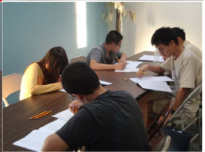
凤凰城华人基督教会中文学校学生在“中华文化大赛”书面考试中认真答卷