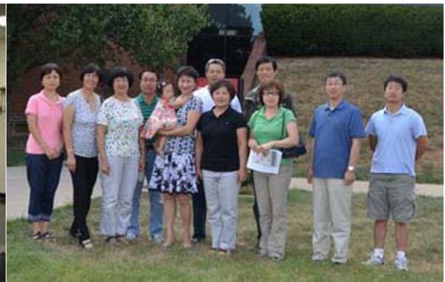
讲师团成员与大辛辛那提中文学校部分志愿者合影