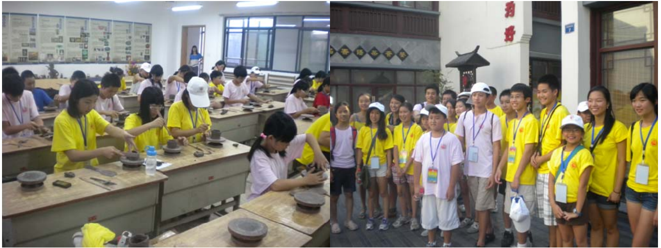
江苏省侨办 2012 “金辉夏令营”美国队学生