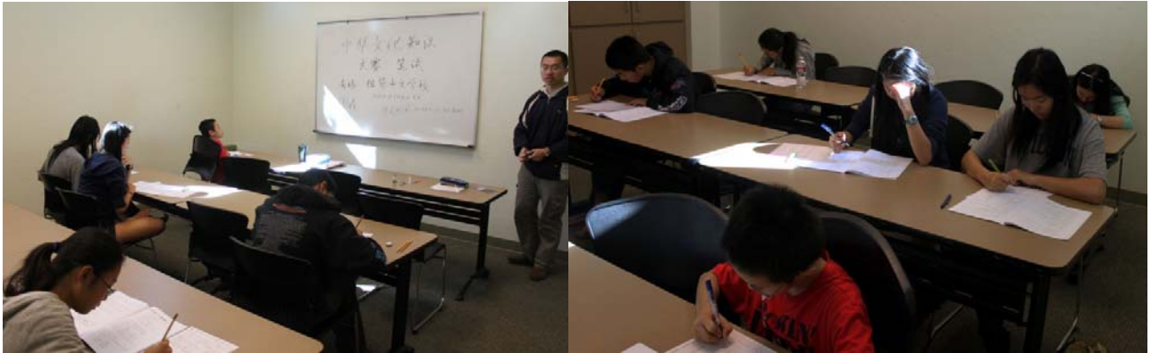
2012 年首届海外华裔青少年中华文化知识大赛图森考点的学生正在进行笔试