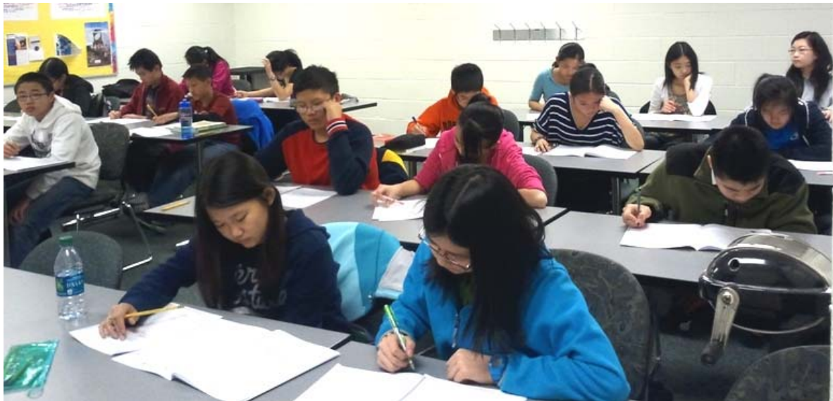
密西根新世纪中文学校的学生在认真答卷