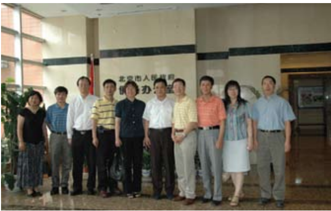
北京市侨办杨副主任等与访问团合影