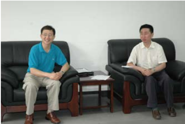
李会长与国侨办文宣司雷副司长亲切座谈